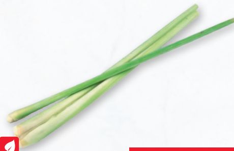
TRAWA CYTRYNOWA 250 G 590097