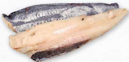
MIRUNA FILET ZE SKÓRĄ BOX opakowanie ok. 3 kg 659574