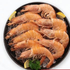
KREWETKI GOTOWANE 40-60 BOX opakowanie ok. 2 kg 934944