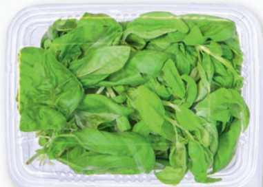
BAZYLIJA CIĘTA 200 G 325551