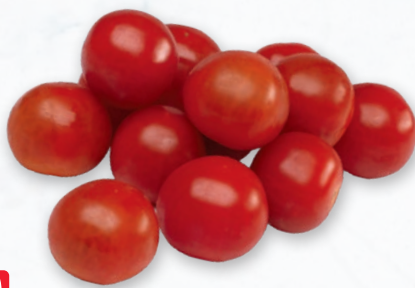
POMIDOR CHERRY CZERWONY 3 KG 976412