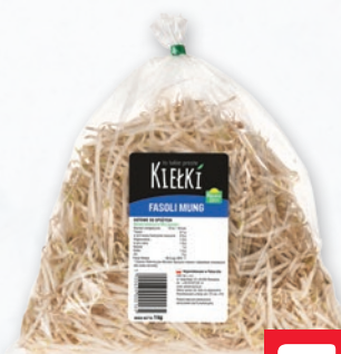
KIEŁKI FASOLI MUNG 1 KG 7999