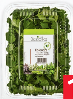
KOLENDRA CIĘTA 200 G 625071