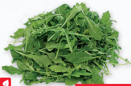
SAŁATA RUKOLA MYTA 500 G 340903