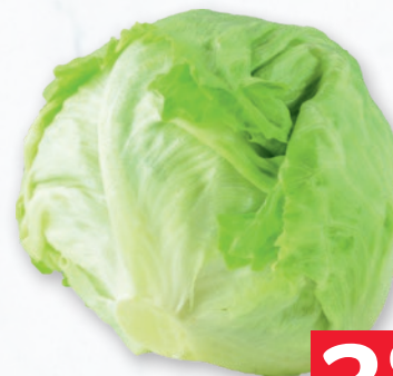
SAŁATA LODOWA 30035