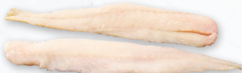
MINTAJ FILET BEZ SKÓRY BOX opakowanie ok. 3 kg 850436