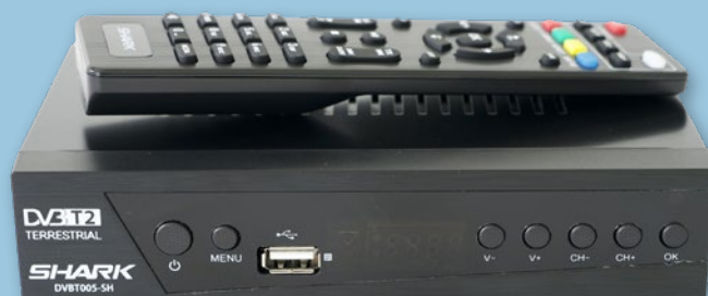
TUNER DVBT-T2 SHARK DVBT005-SH 346884