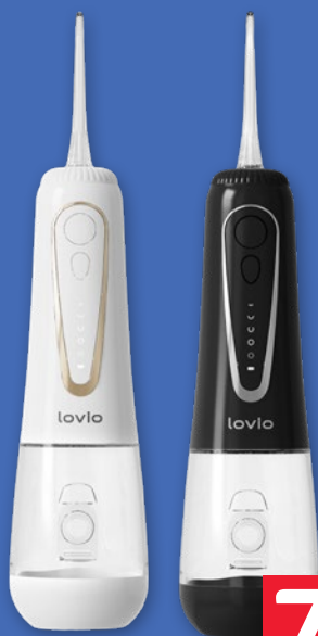
IRYGATOR DO ZĘBÓW LOVIO • dwa kolory: czarny i biały 200888