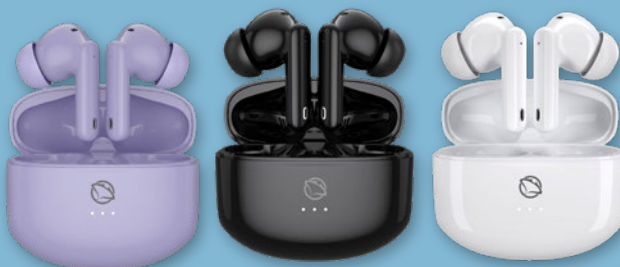
SŁUCHAWKI MTWS008W • kolory: biały, czarny, fioletowy 243077