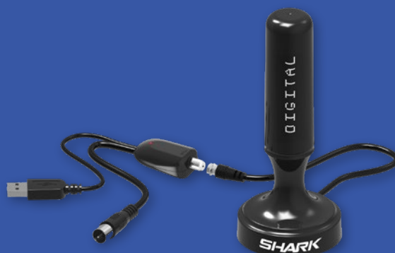
ANTENA SHARK SHA301CAR MANTA 166107