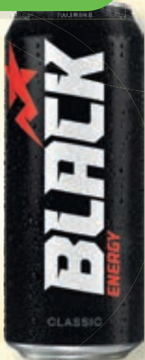
Napój energetyczny BLACK