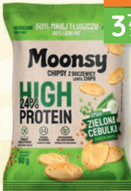
Chipsy MOONSY 60 g, różne rodzaje