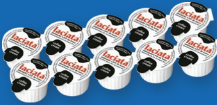
ŚMIETANKA UHT 10 x 10 ML 91633