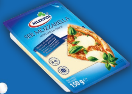
MOZZARELLA PLASTRY 150 G 790709