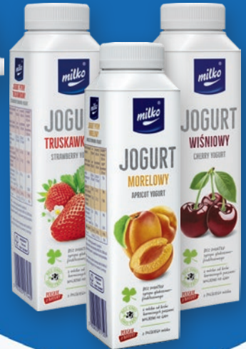
JOGURT OWOCOWY PITNY 330 G • wszystkie smaki 202532