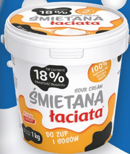
ŚMIETANA 18% 1 KG 186208