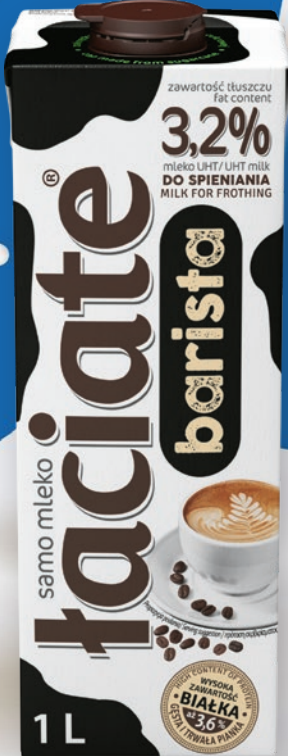
MLEKO BARISTA UHT 3,2% 1 L 63757