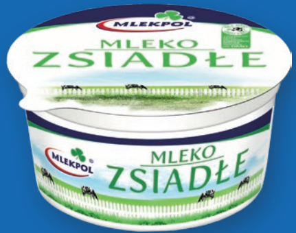
MLEKO ZSIADŁE 380 G 599641