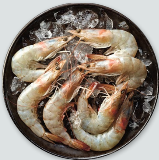
KREWETKI BIAŁE SUROWE 30-40 190507