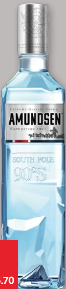
WÓDKA AMUNDSEN 40% 700 ML 32260