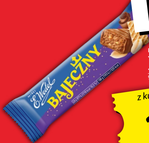
BATON E.WEDEL 31-45 G • cena za 1 szt.: 1.59, z VAT 1.96 • wybrane rodzaje 971986

z kuponem z Aplikacji 1 49 1 szt. z VAT 1.83