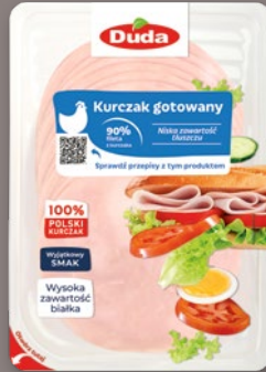
KURCZAK GOTOWANY PŁASTRY 80 G 109773