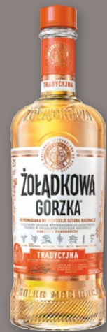
ŻOŁĄDKOWA GORZKA 34% 500 ML • wybrane smaki • 700 ml w cenie: 30.99, z VAT 38.12 277640