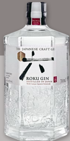
GIN ROKU 43% 700 ML 664569