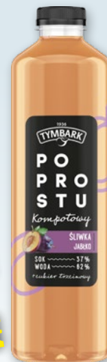
NAPOJE TYMBARK 1,25 L • różne rodzaje 837741

z kuponem z Aplikacji 3 79 1 szt. z VAT 3.98