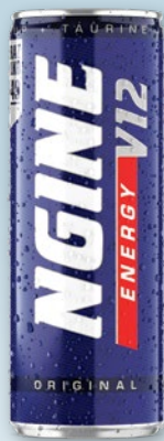
NAPOJE ENERGETYCZNE 250 ML 870690