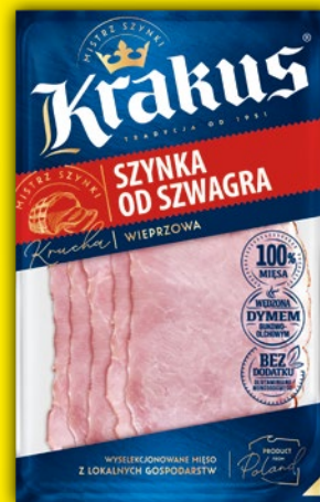
SZYŃKA OD SZWAGRA PŁASTRY 90 G • najniższa cena towaru w okresie 30 dni przed wprowadzeniem obniżki za 1 szt.: 6.99, z VAT 7.34 771694