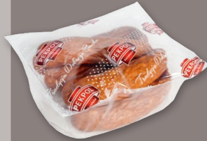
KIEŁBASA ŚLĄSKA OK. 0,8 KG 775420