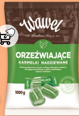
KARMEŁKI TWARDE WAWEL 1 KG • różne rodzaje 110554