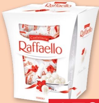
RAFFAELLO 230 G 133173