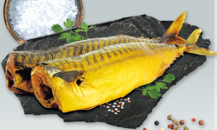
MAKRELA TUSZA WĘDZONA DUŻA 374299