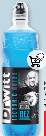
NAPOJE IZOTONICZNE 750 ML • różne rodzaje 732299