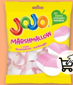
JOJO MARSHMALLOW 86 G 490300