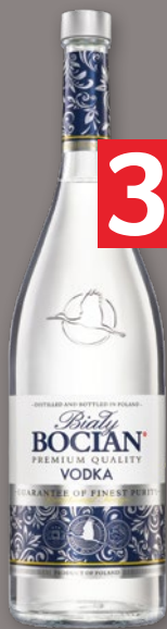
WÓDKA BIAŁY BOCIAN 40% 700 ML 311544