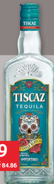
TISCAZ SILVER 35% 700 ML 638940