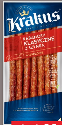
KABANOSY Z SZYNKĄ 180 G 237108