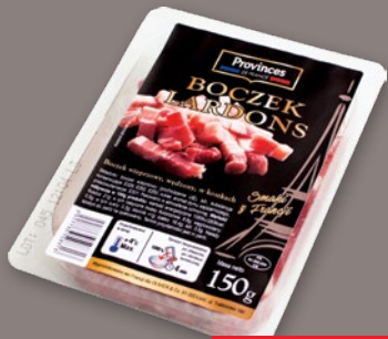
BOCZEK LARDONS KOSTKA 150 G 263298