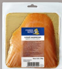
ŁOSOŚ ATLANTYCKI WĘDZONY PLASTRY 200 G 586296