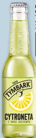
NAPOJE CYTRONETA TYMBARK 330 ML • różne rodzaje 490311