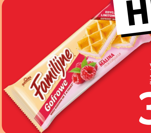
WAFLE FAMILIJNE 130-180 G • wybrane rodzaje 868726