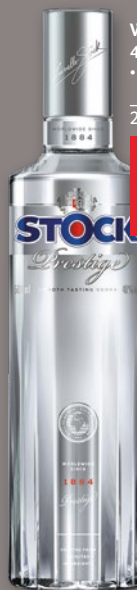
WÓDKA STOCK PRESTIGE 40% 500 ML • 700 ml w cenie: 30.99, z VAT 38.12 284802