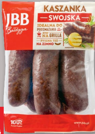
KASZANKA SWOJSKA Z WĄTRÓBKĄ 570 G 843206