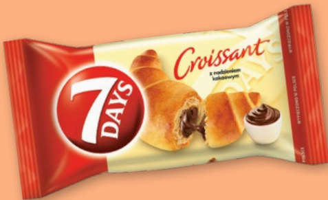
ROGAL 7DAYS 60 G • wybrane rodzaje • cena za 1 szt.: 2.49, z VAT 2.62 737934

z kuponem z Aplikacji 1 49 1 szt. z VAT 1.56