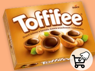
TOFFIFEE 400 G 766791