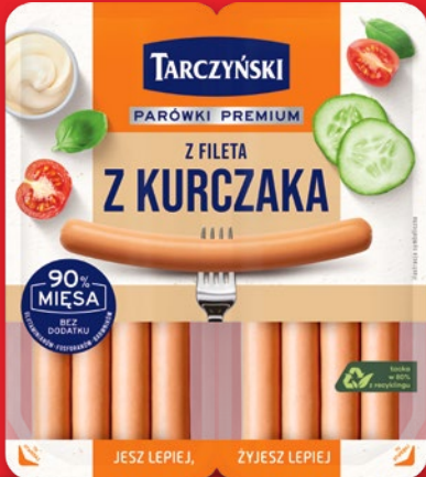
PARÓWKI • różne rodzaje i gramatury 556306