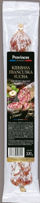
KIEŁBASA FRANCUSKA Z ORZECHAMI ŁASKOWYMI 200 G 728292