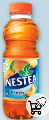
NAPOJE NESTEA 500 ML • różne rodzaje 340465