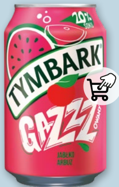
NAPOJE TYMBARK 330 ML • różne rodzaje 243673