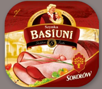
SZYŃKA PŁASTRY • różne rodzaje i gramatury 603616