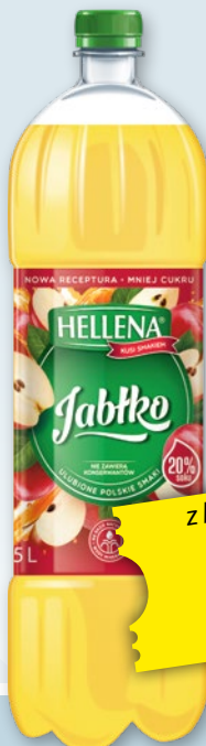
HELLENA NAPÓJ JABŁKO 1,75 L • różne rodzaje • cena za 1 szt.: 4.79, z VAT 5.03 • najniższa cena towaru w okresie 30 dni przed wprowadzeniem obniżki za 1 szt.: 4.79, z VAT 5.03 9828

z kuponem z Aplikacji 3 79 1 szt. z VAT 3.98