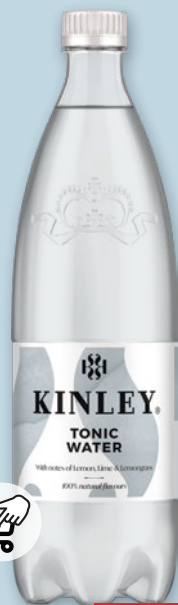
NAPOJE KINLEY 1 L • różne rodzaje 970001