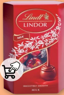
LINDOR 200 G • różne rodzaje 298172