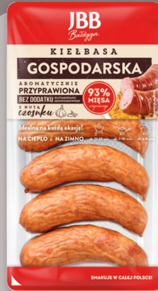
KIEŁBASA GOSPODARSKA 470 G 905080