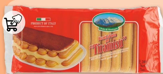
BISKOPTY DO TIRAMISU 200 G 49603

z kuponem z Aplikacji 1 49 1 szt. z VAT 1.56