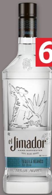
EL JIMADOR BLANCO 38% 700 ML 487342