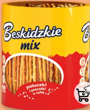
BESKIDZKIE TUBA MIX 275 G 7354