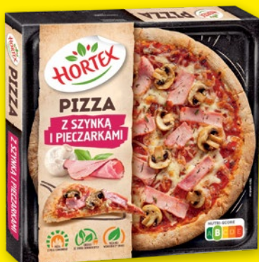
PIZZA 285/375 G • różne rodzaje • cena za 1 szt.: 8.99, z VAT 9.44 • najniższa cena towaru w okresie 30 dni przed wprowadzeniem obniżki za 1 szt.: 10.99, z VAT 11.54 745991

z kuponem z Aplikacji 7 99 1 szt. z VAT 8.39