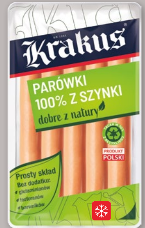
PARÓWKI 185 G • różne rodzaje 864082