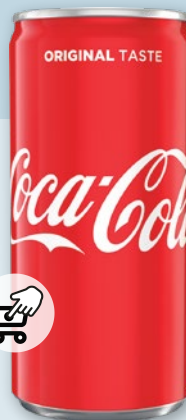
NAPOJE COCA-COLA 200 ML • w promocji również Coca-Cola Zero 200 ml 637301