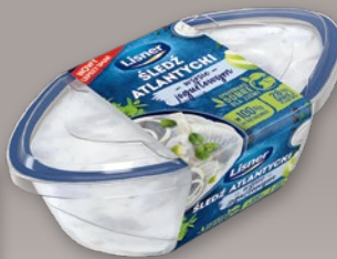
FILETY ŚLEDZIOWE W SOSACH 280 G • różne rodzaje 556749