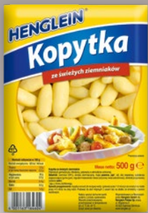
KOPYTKA 500 G 413633