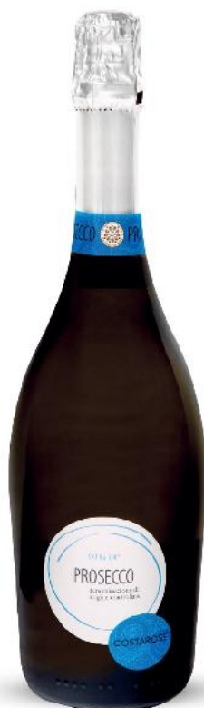
COSTAROSS PROSECCO Wino musujące białe półwytrawne 0,75 l butelka (=11 29,32)

24,99 najniższa cena z 30 dni przed obniżką 21,99