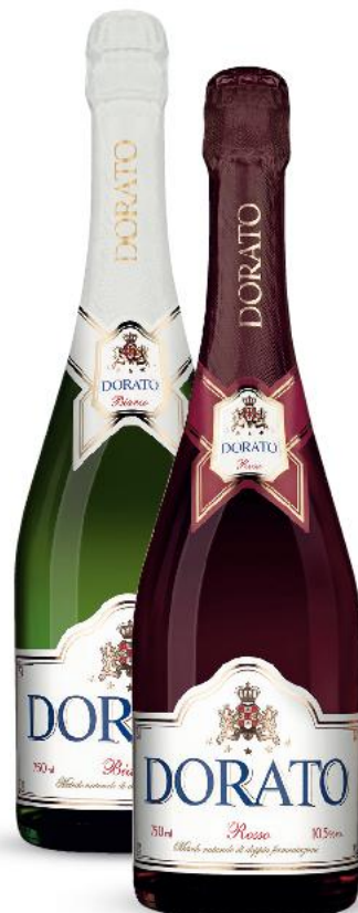
DORATO Wino musujące różne rodzaje 0,75 l butelka (=11 15,99)