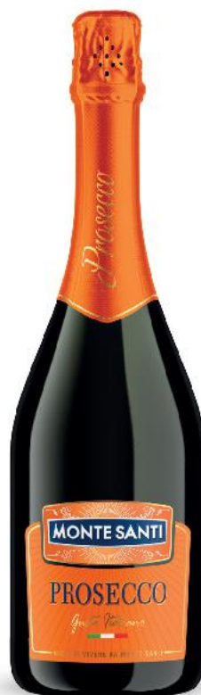
MONTE SANTI PROSECCO Wino musujące białe wytrawne 0,75 l butelka (=11 33,32)

24,99 najniższa cena z 30 dni przed obniżką 21,99