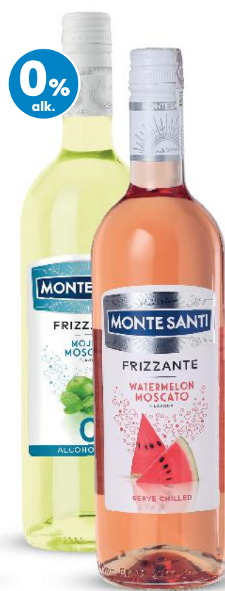
MONTE SANTI FRIZZANTE Wino półmusujące różne rodzaje 0,75 l butelka (=11 21,32)