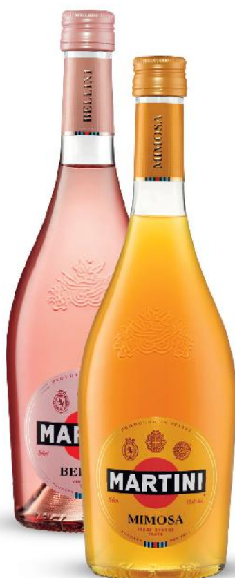
MARTINI MIMOSA, BELLINI Wino musujące 0,75 l butelka (=11 39,99)

pasuje do sałatek owocowych, deserów, jako aperitif