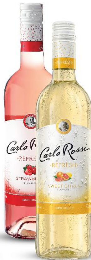
CARLO ROSSI REFRESH Wino półmusujące różne rodzaje 0,75 l butelka (=11 29,32)