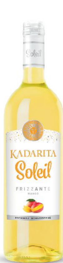
KADARITA Soleil Wino musujące białe półsłodkie 0,75 l butelka (=11 15,99)