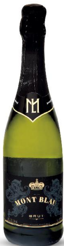
MONT BLAU BRUT Wino musujące białe półwytrawne 0,75 l butelka (=11 23,99)