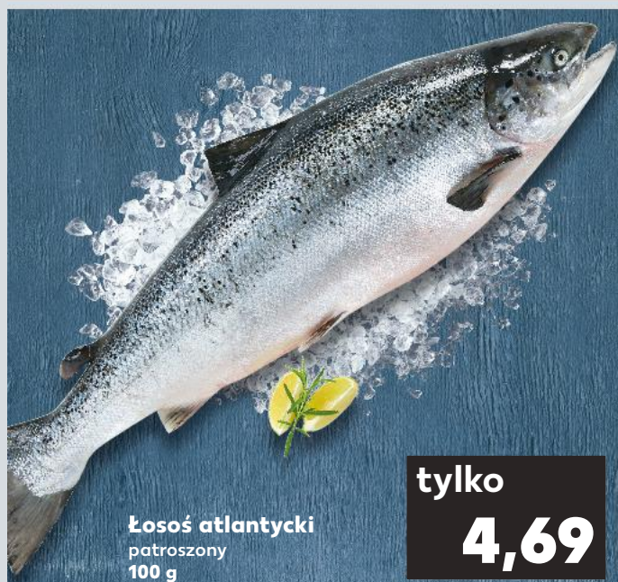
Łosoś atlantycki patroszony 100 g