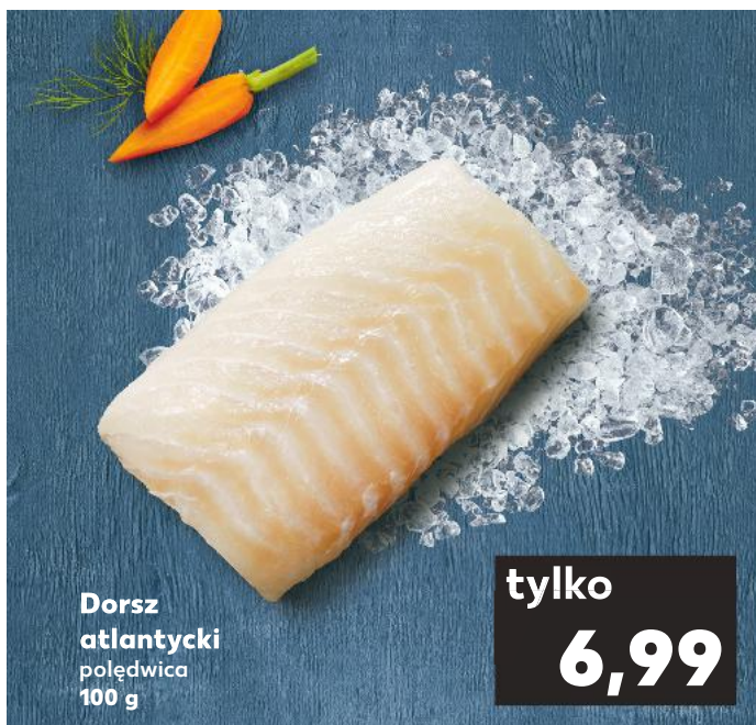
Dorsz atlantycki połędwica 100 g

Czosnek obrać i zgnieść. Papryczkę chili przekroić wzdłuż, usunąć pestki, umyć i pokroić w kosteczkę. Do woreczka strunowego włożyć sos teriyaki, czosnek, chili, curry, paprykę i 2 łyżki oleju, dokładnie wymieszać. Rybę umyć, osuszyć, włożyć do marynaty i chłodzić ok. 30 minut. Pomidorki i cukinię umyć. Cukinię pokroić w plastry. Rybę wyjąć z marynaty, włożyć do naczynia żaroodpornego i piec w temp. 160°C przez 15–20 minut. Plastry cukinii i pomidorki podsmażyć na pozostałym oleju, dodać miód i krótko karmelizować. Marynatą z ryby skropić warzywa i doprawić solą. Warzywa i rybę wyłożyć na talerze. Można posypać podprażonym sezamem i podawać z ryżem basmati.