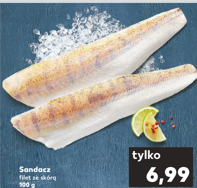
Sandacz filet ze skórą 100 g