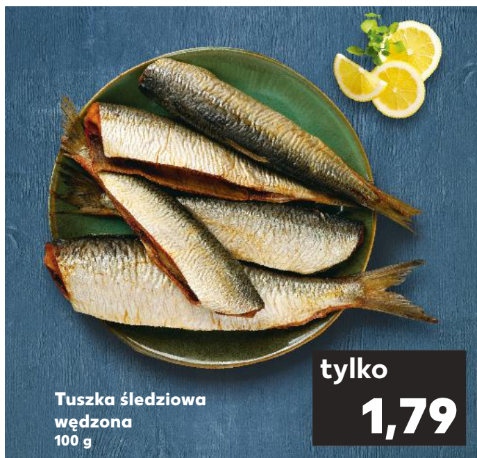
Tuszka śledziowa wędzona 100 g