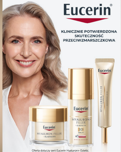
Oferta dotyczy serii Eucerin Hyaluron+ Estetic.

KLINICZNIE POTWIERDZONA SKUTECZNOŚĆ PRZECIWMARSZCZKOWA