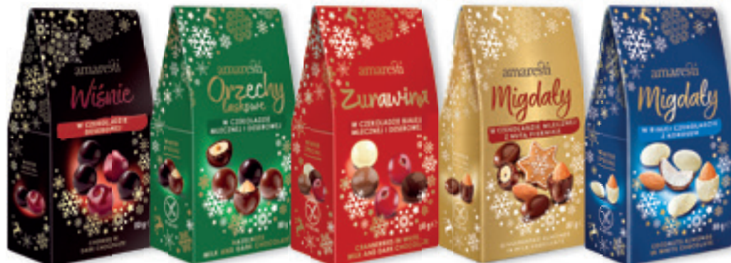
AMARESTI 80 G: