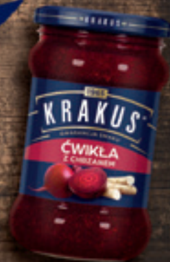
KRAKUS ĆWIKŁA Z CHRZANEM 300 G