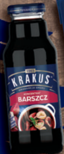
KRAKUS KONCENTRAT BARSZCZU CZERWONEGO 300 ML