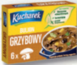
BULION GRZYBOWY 60 G