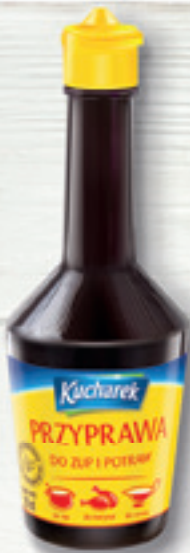
PRZYPRAWA DO ZUP I POTRAW W PŁYNIE 181 ML