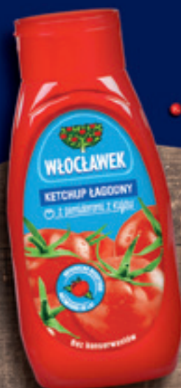
WŁOCŁAWEK KETCHUP 480 G: ŁAGODNY, PIKANTNY