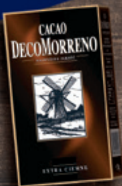
KAKAO DECOMORRENO 80 G