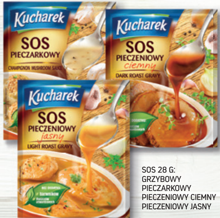
SOS 28 G: GRZYBOWY PIECZARKOWY PIECZENIOWY CIEMNY PIECZENIOWY JASNY