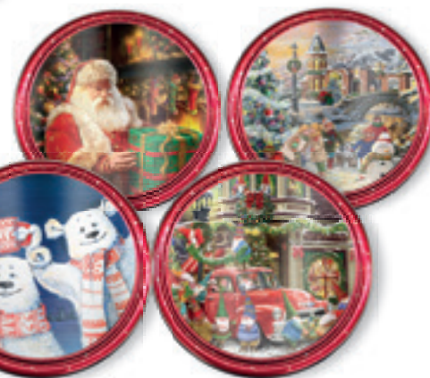
CIASTKA O SMAKU MAŚLANYM 340 G