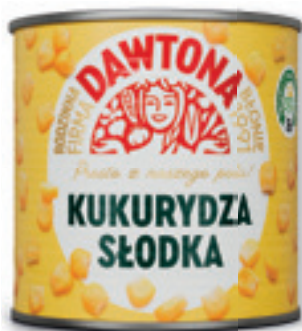
KUKURYDZA KONSERWOWA 400/220 G