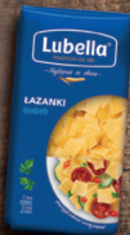
ŁAZANKI 400 G