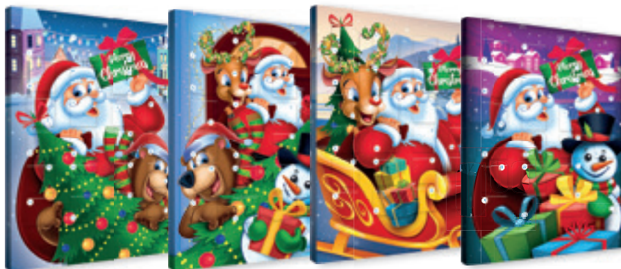
KALENDARZ ADWENTOWY 75 G