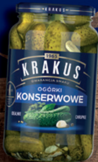
KRAKUS OGÓRKI KONSERWOWE 920 G