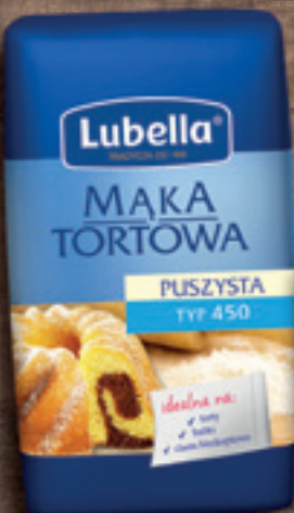
MAKA PUSZYSTA 1 KG: POZNAŃSKA, TORTOWA, WROCŁAWSKA