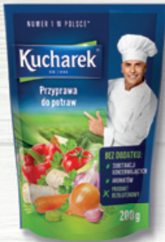
PRZYPRAWA DO POTRAW 200 G