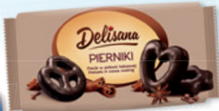
PIERNIKI PRECLE W POLEWIE KAKAOWEJ 400 G