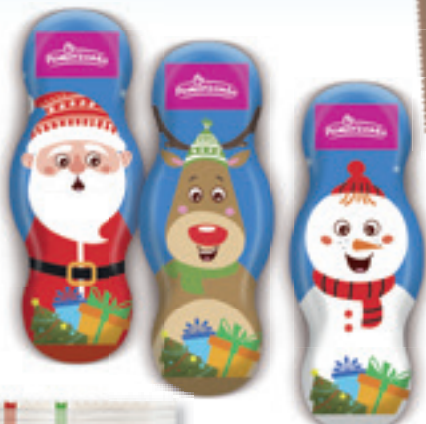
FIGURKI TOFFII 30 G