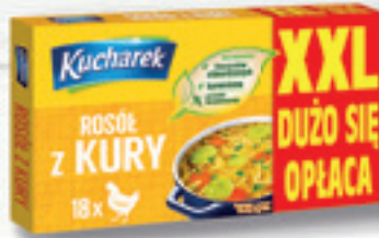
ROSÓL Z KURY 120 G BULION WARZYWNY 120 G