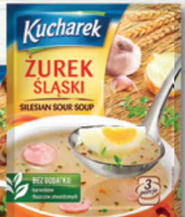
ŻUREK ŚLĄSKI 46 G