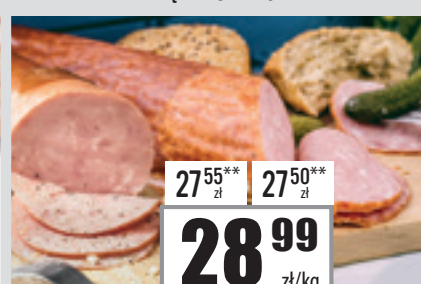
KIEŁBASA PODWAWELSKA FIRMOWA [NIKPOL]