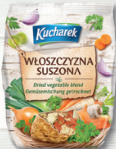
WŁOSZCZYZNA SUSZONA 100 G