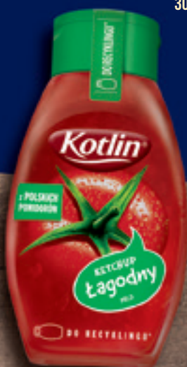
KOTLIN KETCHUP 450 G: ŁAGODNY, PIKANTNY