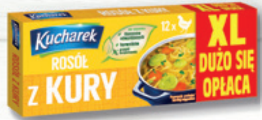
ROSÓL Z KURY 180 G