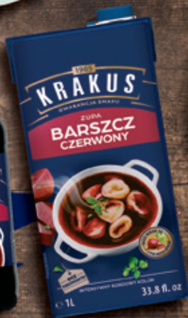
KRAKUS ZUPA BARSZCZ CZERWONY 1 L