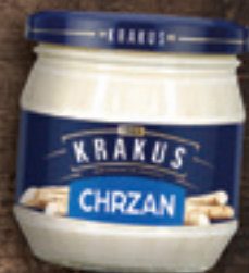
KRAKUS CHRZAN 180 G