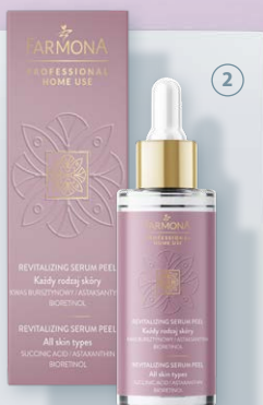
FARMONA Professional Home Use serum peelujące do twarzy, 30 ml 100 ml = 233,30 zł

49,99 Cena regularna 49,99 Najniższa cena z 30 dni przed obniżką