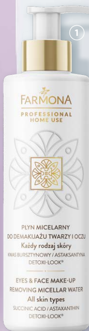
FARMONA Professional Home Use płyn micelarny do demakijażu, 280 ml 100 ml = 14,28 zł