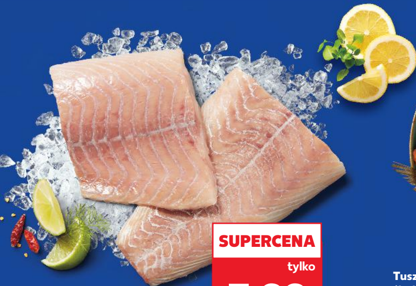
Dorsz czarny filet bez skóry 100 g

Oliwki zmiksować z oliwą i pietruszką, doprawić solą i pieprzem. Rybę umyć, osuszyć i pokroić w dużą kostkę. Pomidorki umyć i na przemian z kawałkami ryby ponadziwiać na patyczki. Szaszłyki posmarować marynatą i odłożyć do lodówki na 30 minut. Papryki przekroić, oczyścić z pestek, umyć i położyć na grillu skórką do dołu. Grillować 4-6 minut, aż skórka szernieje, następnie zanurzyć w lodowatej wodzie, zdjąć skórę i pokroić w drobną kostkę. Serek kozi wymieszać z papryką i tymiankiem, doprawić solą i pieprzem. Szaszłyki posypać solą i pieprzem, ułożyć na posmarowanej olejem folii i grillować z każdej strony 4-6 minut. Podawać z dipem i grillowanym chlebem.