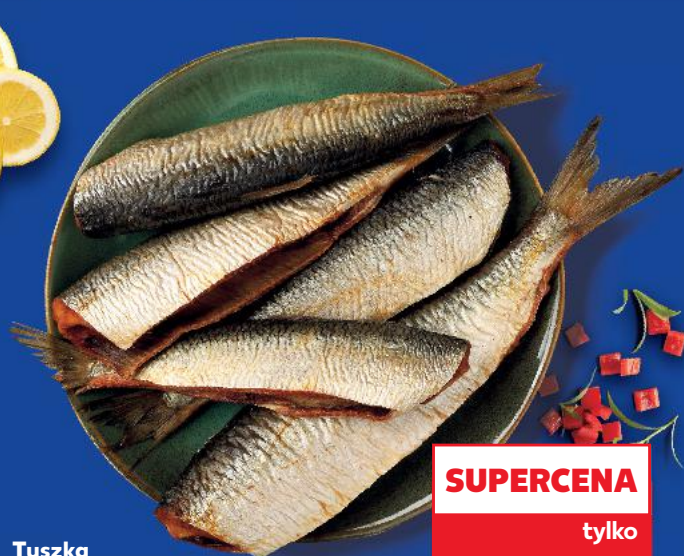
Tuszka śledziowa wędzona 100 g