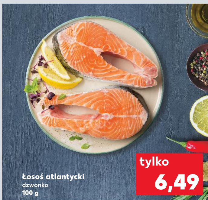
Łosoś atlantycki dzwonko 100 g