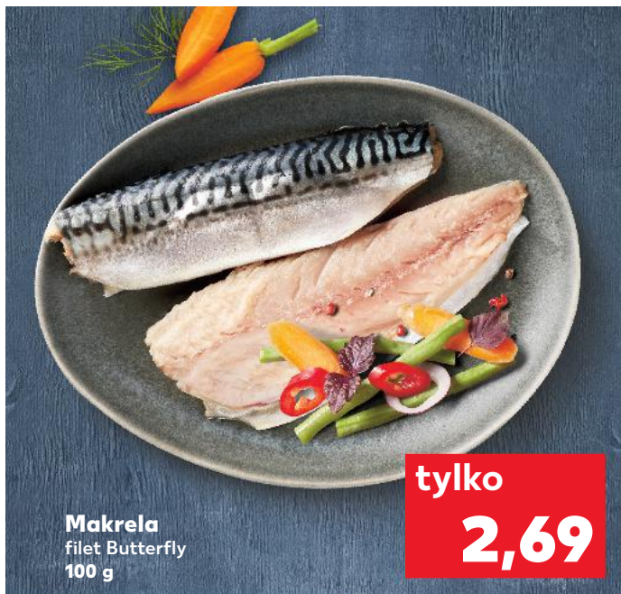
Makreła filet Butterfly 100 g

Filety z makreli umyć i osuszyć. Wymieszać sok z limonki z miodem i posmarować rybę, a następnie posolić i obtoczyć w mące. Jajko ubić trzepaczką, wiórki kokosowe wymieszać z bułką tartą. Filety obtoczyć najpierw w jajku, a następnie w panierce z wiórkami. Ryż gotować w osolonej wodzie 15-20 minut. Zagotować mleczko kokosowe i bulion rybny, poczekać, aż woda lekko odparuje, a następnie dodać zasmażkę, pastę curry i posolić. Filety rybne smażyć na rozgrzanym oleju z obu stron przez ok. 8-10 minut na kolor złotobrązowy. Podawać z ryżem i sosem.