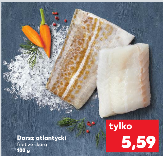
Dorsz atlantycki filet ze skórą 100 g