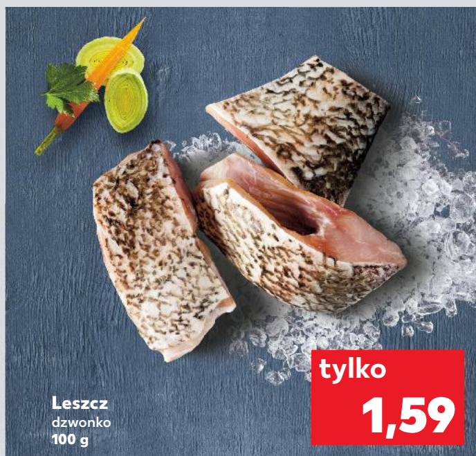
Łeszc dzwonko 100 g