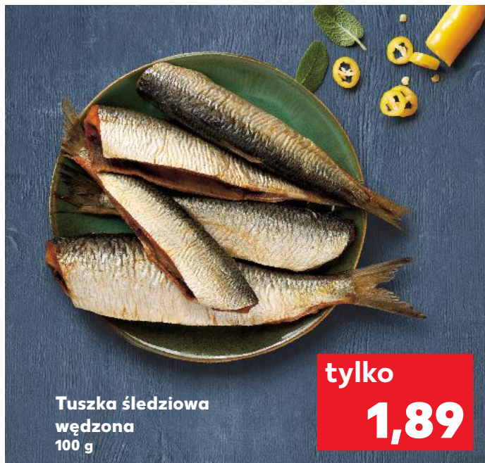
Tuszka śledziowa wędzona 100 g