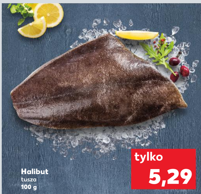
Halibut tusza 100 g