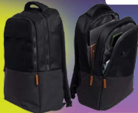
PLECAK NA LAPTOPA 16" LISBOA CZARNY