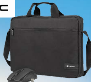
TORBA DO NOTEBOOKA 15,6 CALI WALLAROO +MYSZ