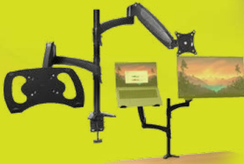
UCHWYT MARA NA MONITOR I LAPTOPA