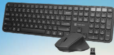
ZESTAW KŁAWIATURA + MYSZ OCTOPUS 2 BLUETOOTH + 2.4GHZ