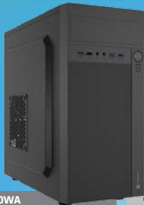
OBUDOWA HELIX USB-C MATX MINI TOWER