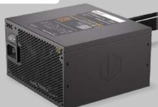
ZASILACZ VERO L5 BRONZE 700W