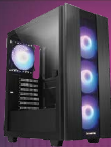
OBUDOWA GS-02B-OP HUNTER 2 MIDI TOWER