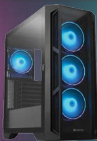
OBUDOWA APEX GA-01B-TG-OP