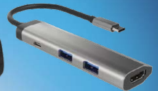
STACJA DOKUJĄCA MULTI PORT FOWLER SLIM