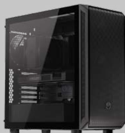
OBUDOWA ARX 700 AIR EY2A012