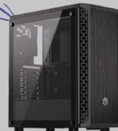
OBUDOWA SIGNUM 300 AIR