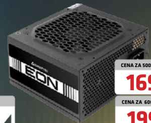
ZASILACZ ZPU-500S EON SERIES 80 PLUS