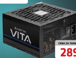
ZASILACZ BPX-750-S VITA SERIES ATX