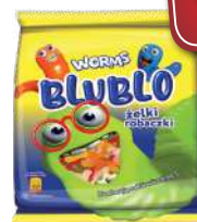
Żelki robaczki 80 g S01100000590