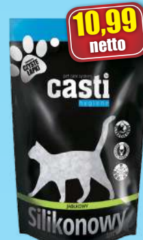
zapach jabłkowy S07030000183