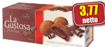
Ciasteczka LA GUSTOSA z kremem czekoladowym 150 g S01050000142