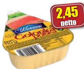
Konserwa Golonka polska Werbliński 110 g S05010000060