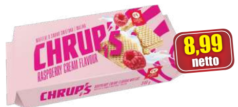
Wafle Chrup's śmietankowo-malinowe 340 g S01020000203