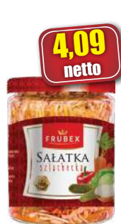
4,09 netto Sałatka szlachecka 500 ml S05060000111