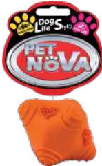
Zabawka dla psa piłka wariatka pomarańczowa aromat wanilia 5 cm S07030000126