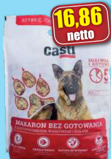
Makaron dla psa błyskawiczny z mięsem 3 kg S0703000006