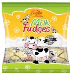
Cukierki Krówka mleczna Fudges Milk 200 g S01100000154