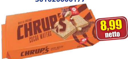
Wafle Chrup's kakao 340 g S01020000175