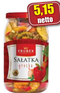
5,15 netto Sałatka grecka 900 ml S05060000138