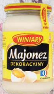
Majonez Winiary 400 ml S05020000029 Majonez Winiary 700ml S05020000030