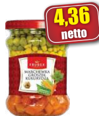
4,36 netto Mieszanka marchew + groszek 500 ml S05060000124