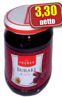
3,30 netto Buraczki wiórki 500 ml S05060000106