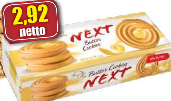
Ciasteczka Next maślane 135 g S01050000175