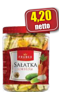
4,20 netto Sałatka szwedzka 500 ml S05060000114