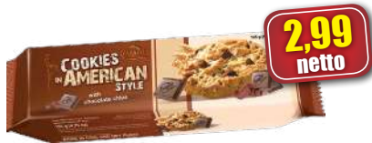
Ciasteczka IN AMERICAN STYLE z czekoladą 135 g S01050000152