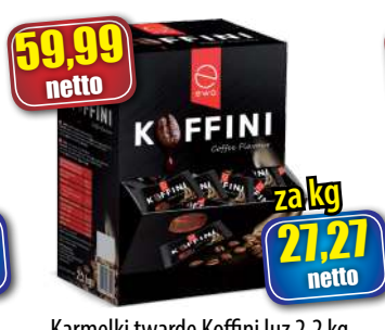
Karmelki twarde Koffini luz 2,2 kg S01100000594