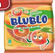
Żelki brzoskwinke 80 g S01100000609