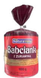
Z żurawiną 100 g S0105000040