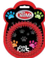
Zabawka dla psa ringo czerwone aromat mięta 12,5 cm S07030000059