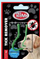
Kleszczołapki tick remover S07030000174