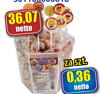
Lizak deseniowy 8 g * 100 szt. S01070000081