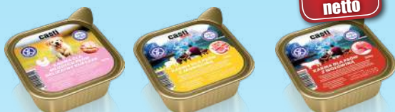
Mokra karma paszтет dla psa 300 g