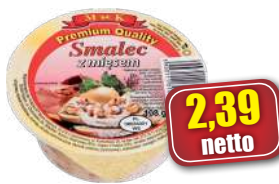
Smalec z mięsem 108 g S05030000101