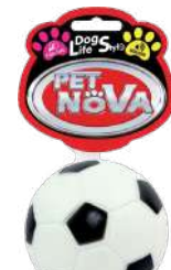
Zabawka dla psa piłka futbolowa 7 cm S07030000081