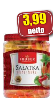
3,99 netto Sałatka ukraińska 500 ml S05060000113