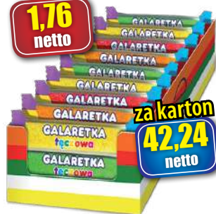
Galaretki Tęczowe 60 g baton S01110000074