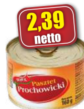
Paszтет prochowski drobiowy 160 g S05050000005