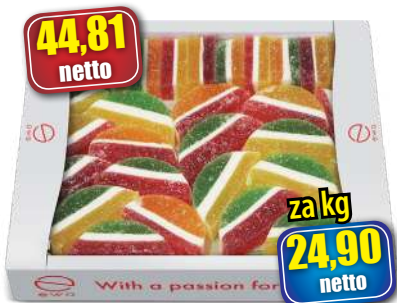
Galaretka tęczowa luz 1,8 kg S01100000193