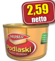
Paszтет Podlaski 155 g Drosed S05050000006