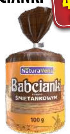
Śmietankowe 100 g S0105000039