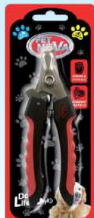
Obcinacz do pazurów S07030000180