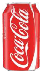
Coca-cola 330 ml S08050000240