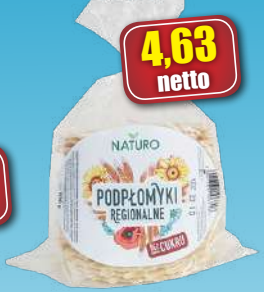
Podpłomyki Regionalne 100 g S01060000303