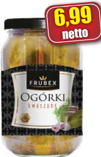
6,99 netto Ogórki kwaszone 900 ml S05060000129