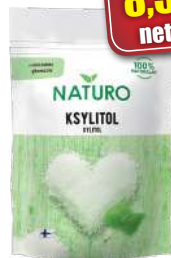
Ksylitol cukier brzozywy 250 g S0406000069