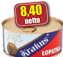
Łopatką wieprzową 300 g S05010000029