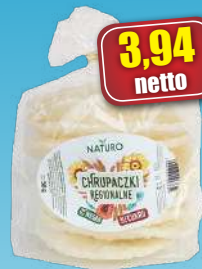
Chrupaczki Regionalne 58 g S01060000305