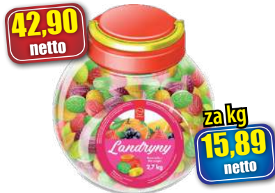
Landryny owocowe luz 2,7 kg S01100000617