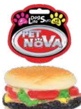
Zabawka dla psa hamburger z posypką serem i sosem 9 cm S07030000090