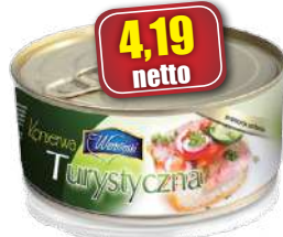
Konserwa turystyczna Werbliński 300 g S05010000056