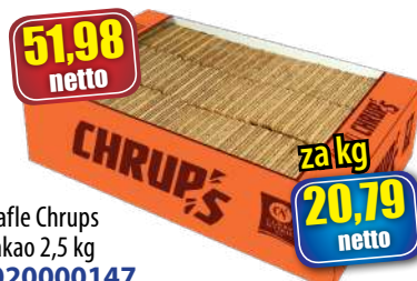
Wafle Chrup's kakao 2,5 kg S01020000147