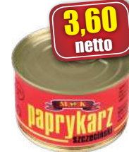
Paprykarz szczeciński 300 g S05050000020