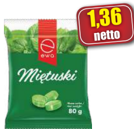
Landryny miętuski 80 g S01100000442