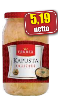
5,19 netto Kapusta kwaszona 900 ml S05060000132