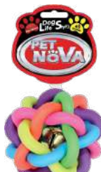
Zabawka dla psa piłka pleciona kolorowa aromat wołowina 10,5 cm S07030000069