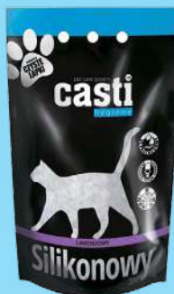
zapach lawendowy S0703000029