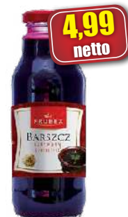
4,99 netto Barszcz czerwony koncentrat 300 ml S05060000107