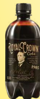
Royal Crown Cola 0,5 l S08050000445