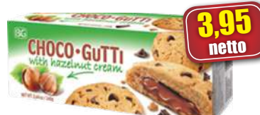
Ciasteczka CHOCO GUTTI z kremem czekoladowym 160 g S01050000148 Ciasteczka CHOCO GUTTI z kremem orzechowym 160 g S01050000147