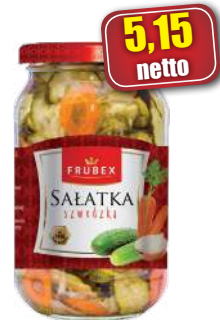
5,15 netto Sałatka szwedzka 900 ml S05060000110