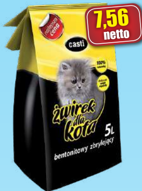
Żwirek bentonitowy zbrzydlający 5l S0703000015