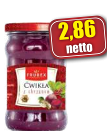
2,86 netto Ćwikła z chrzanem 320 ml S05060000144