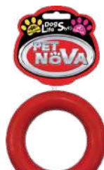
Zabawka dla psa ringo czerwone aromat wanilia 9 cm S07030000123