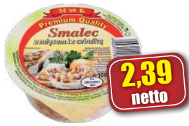
Smalec z cebulką 108 g S05030000102