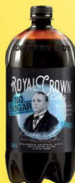
Royal Crown Cola bez cukru 1,33 l S08050000448