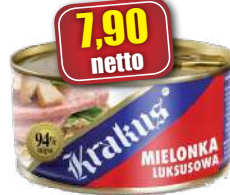
Konserwa mielonka luksusowa 300 g Krakus S05010000046