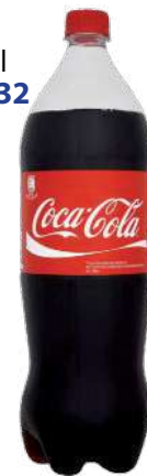
Coca-cola 1,5l S08050000262