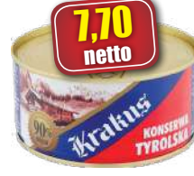
Konserwa tyrolska 300 g Krakus S05010000047