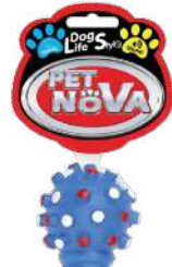
Zabawka dla psa hantel z wypustkami niebieski 16 cm S07030000087