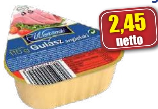
Konserwa Gulasz angielski Werbliński 110 g S05010000062