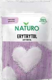
Erytrytol 250 g S04060000070