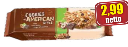
Ciasteczka IN AMERICAN STYLE z czekoladą i orzechami laskowymi 135 g S01050000160