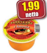
Paprykarz szczeciński z łososiem 152 g S05050000021