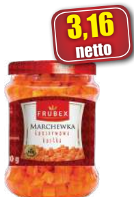
3,16 netto Marchewka konserwowa kostka 500 ml S05060000127