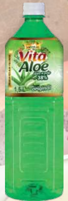
Napój ałoesowy Vita Aloe Original 38% 1,5 l S08050000363