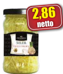
2,86 netto Seler konserwowy 320 ml S05060000137