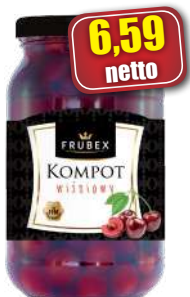
6,59 netto Kompot wiśniowy 900 ml S05070000009