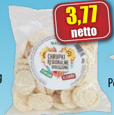
Chrupki Regionalne orkiszowe 60 g S01060000304