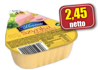
Konserwa Szyńka drobiowa Werbliński 110 g S05010000061