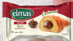
Rogal Elmas kakao 60 g S01050000478