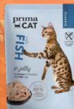
Mokra karma Prima Cat saszetka ryba w galaretkę 85 g S07060000068