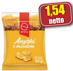
Anyzki z miodem 80 g S01100000443