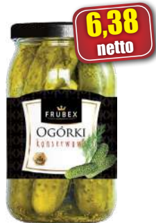
6,38 netto Ogórki konserwowe 900 ml S05060000142