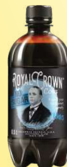
Royal Crown Cola bez cukru 0,5 l S08050000446