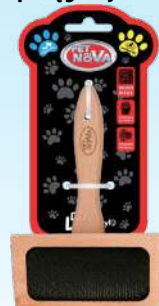
rozmiar M S07030000176 rozmiar S S07030000177