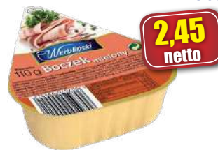
Konserwa Boczek mielony Werbliński 110 g S05010000063