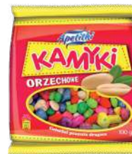
Kamyki orzechowe 100 g S01100000564