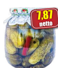
7,87 netto Ogórki korniszony BECZUŁKA 830 ml S05060000010