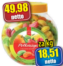
Landryny polkiszcyce luz 2,7 kg S01100000191