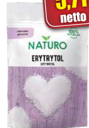
Erytrytol 250 g S0406000070