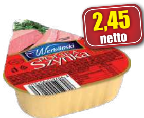
Konserwa Szyńka polska Werbliński 110 g S05010000059