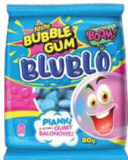
Żelki pianki bubble gum 80g S01100000619