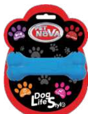
Zabawka dla psa kość na przysmaki niebieska aromat wołowina 11 cm S07030000063