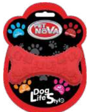
Zabawka dla psa kość gryzak czerwony aromat wołowina 10,5 cm S07030000057