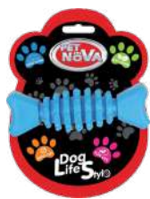
Zabawka dla psa niebieska kość dental aromat mięta 12 cm S07030000054