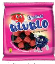
Żelki malinki 80 g S01100000565