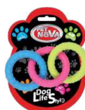
Zabawka dla psa kolorowe połączone kółka aromat mięta 18,5 cm S07030000062