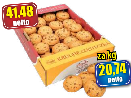
Ciasteczka American Cookies z kawałkami czekolady 2 kg S01050000164