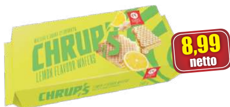
Wafle Chrup's cytrynowe 340 g S01020000202