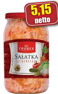
5,15 netto Sałatka szlachecka 900 ml S05060000139