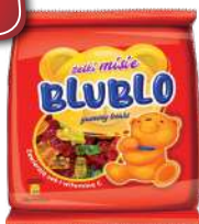
Żelki misie 80 g S01100000571