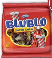
Żelki super cola Blublo 80 g S01100000592