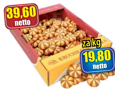
Ciasteczka Tweett z kremem czekoladowym 2 kg S01050000163