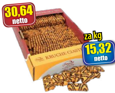
Ciasteczka domowe kruche dekorowane 2 kg S01050000165