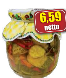
6,59 netto Ogórki koreczki zakąskowe BECZUŁKA 830 ml S05060000199