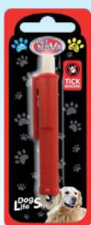
Urządzenie do usuwania kleszczy S07030000175