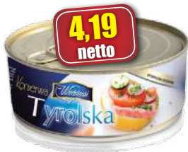
Konserwa tyrolska Werbliński 300 g S05010000055