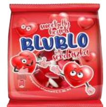
Żelki serduszka 80 g S01100000608