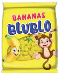
Żelki pianki bananki 80g S01100000598