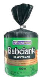
Klasyczne 100 g S0105000041