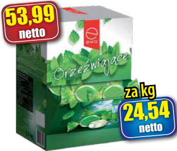
Cukierki orzeźwiające luz 2,2 kg S01100000616