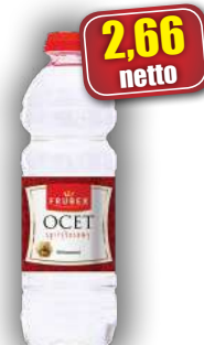
2,66 netto Ocet spirytusowy 10% 500 ml S08040000008