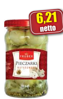
6,21 netto Pieczarki marynowane 320 ml S05060000120