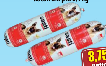
Baton dla psa 0,9 kg