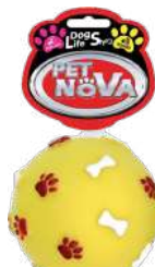
Zabawka dla psa piłka ze wzorem łapek i kości żółta 7,5 cm S07030000078