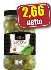
2,66 netto Szczaw siekany konserwowy 320 ml S05060000134