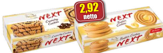
Ciasteczka Next domowe 135 g S01050000392