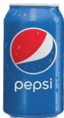
Pepsi 330 ml S08050000152