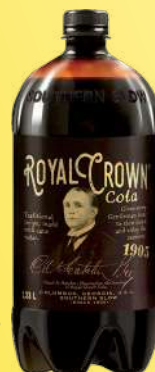
Royal Crown Cola 1,33 l S08050000447