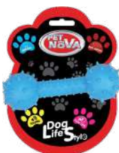
Zabawka dla psa hantel z dzwonkiem niebieski aromat wołowina 14 cm S07030000055