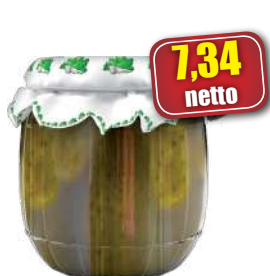
7,34 netto Ogórki kwaszone BECZUŁKA 830 ml S05060000009