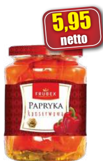
5,95 netto Papryka konserwowa 720 ml S05060000131