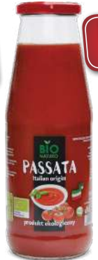
Passata pomidorowa BIO 690 g S08100000042