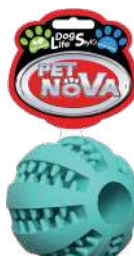
Zabawka dla psa piłka baseball kolor i aromat mięta 5 cm S07030000127