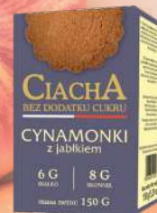
Ciacha Cynamonki z jabłkiem 150 g S01050000468