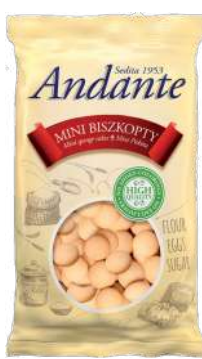
Biskopki Mini 120 g S0102000054