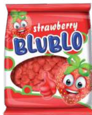
Żelki pianki truskawki 80g S01100000599