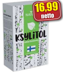
Ksylitol cukier brzozywy 500 g S0406000061