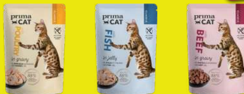
drób w sosie S0706000069 ryba w galaretkie S0706000068 wołowina w sosie S0706000067