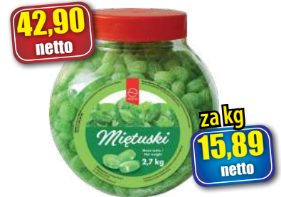
Landryny miętuski luz 2,7 kg S01100000618