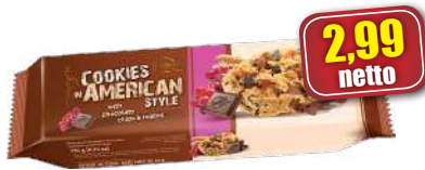
Ciasteczka IN AMERICAN STYLE z czekoladą i rodzynkami 135 g S01050000153