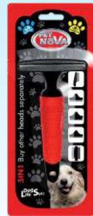
Trymer do wyczesywania podszerełka/sierści S07030000182