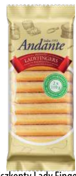
Biskopki Lady Fingers 220 g S0102000161