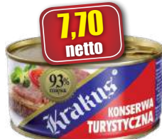
Konserwa turystyczna lux 300 g Krakus S05010000027