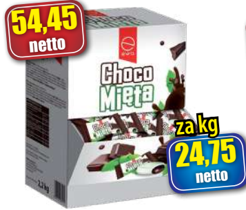
Karmelki Choco mięta luz 2,2 kg S01100000620