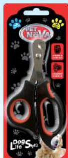
Nożyczki do pazurów S07030000181