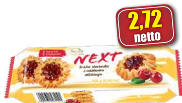
Ciasteczka Next słoneczka z marmoladą 160 g S01050000391