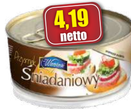
Konserwa przysmak śniadaniowy Werbliński 300 g S05010000057