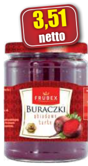
3,51 netto Buraczki obiadowe tarte 500 ml S05060000180