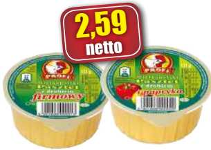
Paszтет z drobiem i pieczarkami 131 g Profi S05050000024