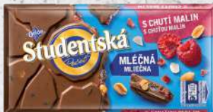
Czekolada malinowa 170 g Studentska S01030000161