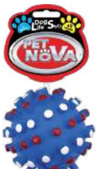
Zabawka dla psa piłka jeż z wypustkami niebieska 8,5 cm S07030000074