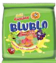
Żelki kwaśne 80 g S01100000580