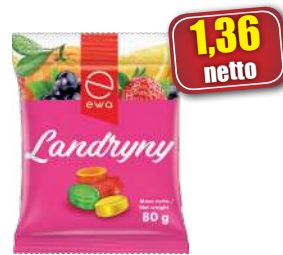
Landryny owocowe 80 g S01100000441