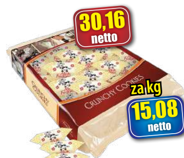
Cukierki Krówka mleczna 2 kg S01100000153