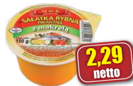
Sałatka rybna z makrelą pikantna 150 g MK S05060000162