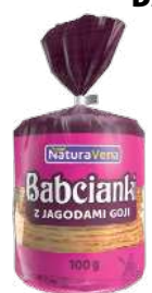
Z jagodami goji 100 g S0105000068