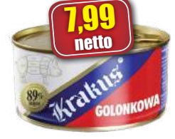
Konserwa golonkowa 300 g Krakus S05010000045