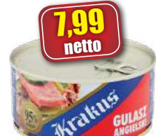
Gulasz angielski 300 g Krakus S05010000028