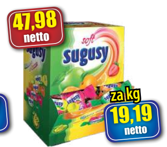
Cukierki owocowe Sugusy luz 2,5 kg S01100000188