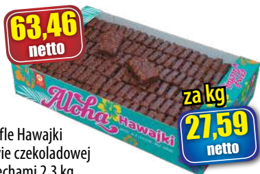
Wafle Hawajki w polewie czekoladowej z orzechami 2,3 kg S01020000177