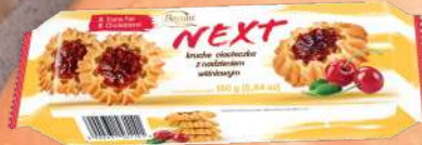
Ciasteczka Next słoneczka z marmoladą 160 g S01050000391