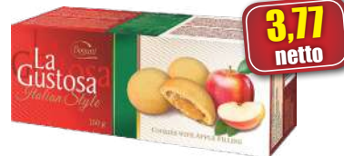
Ciasteczka LA GUSTOSA apple feeling 150 g S01050000177