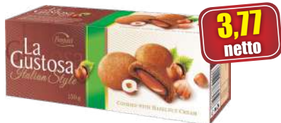
Ciasteczka LA GUSTOSA z kremem orzechowym 150 g S01050000143