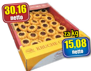
Ciasteczka słoneczka z marmoladą 2 kg S01050000161