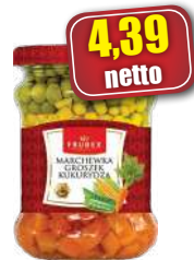
4,39 netto Mieszanka marchew + groszek + kukurydza 500 ml S05060000125