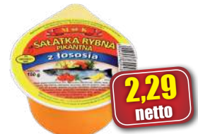
Sałatka rybna z łososiem pikantna z warzywami 150 g MK S05060000161