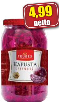
4,99 netto Kapusta czerwona 900 ml S05060000133