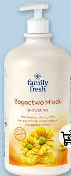
FAMILY FRESH ŻEL POD PRYSZNIC 1000 ML • różne rodzaje 85983963 645731