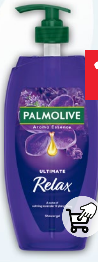
PALMOLIVE ŻEL POD PRYSZNIC 750 ML • różne rodzaje 21917224 1400