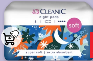
CLEANIC PODPASKI, WKŁADKI • wybrane rodzaje 50126119 974991