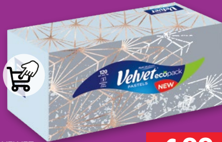
VELVET CHUSTECZKI 120 SZT. • dwa rodzaje 34947978 231721