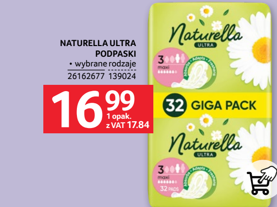
NATURELLA ULTRA PODPASKI • wybrane rodzaje 26162677 139024

To jest wyrób medyczny. Używaj go zgodnie z instrukcją używania lub etykietą.