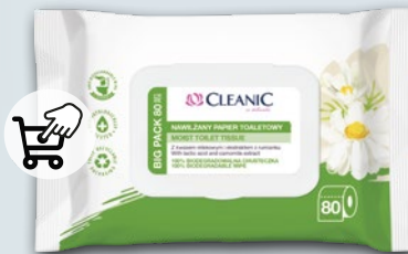
CLEANIC PAPIER TOALETOWY NAWILŻANY RUMIAKOWY 80 SZTUK 29380342 45162