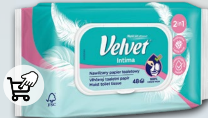
VELVET PAPIER NAWILŻANY 48 SZT. • trzy rodzaje 77175305 495650