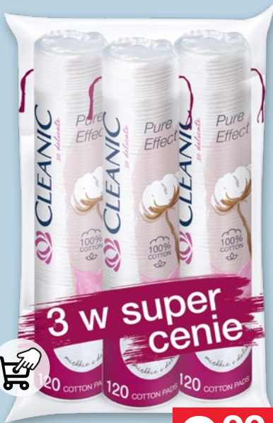
PLĄTKI CLEANIC 3 x 120 SZTUK 19856897 122297