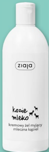
ZIAJA ŻEL MYJĄCY 500 ML • różne rodzaje 21940317 305497