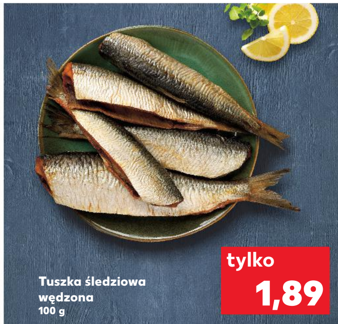
Tuszka śledziowa wędzona 100 g