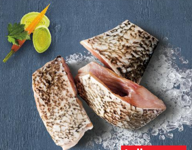
Leszcz dzwonko 100 g