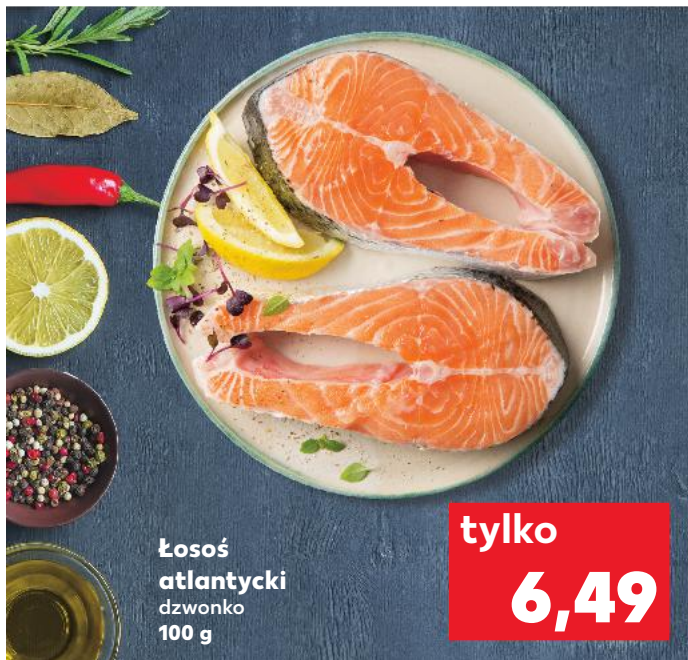
Łosoś atlantycki dzwonko 100 g

Ogórkę zielonego obrać i pokroić w cienkie plasterki. Ogórek konserwowy również pokroić w cienkie plasterki. Szczypiorek opłukać, osuszyć i posiekać. Białą część dymki oczyścić, umyć i bardzo drobno pokroić. Przygotowane składniki ułożyć na talerzach. Wymieszać ocet z solą, pieprzem, cukrem i 3 łyżkami oleju. Trochę zostawić, resztą skropić ogórki. Dzwonka łososia opłukać i osuszyć. Pozostały olej rozgrzać, smażyć łososia przez 3-4 minuty z każdej strony. Doprawić solą i pieprzem. Usmażone dzwonka łososia ułożyć na ogórkach, połączyć pozostałą marynatą i podawać przybrane np. rzęszuchą i kolendrą.