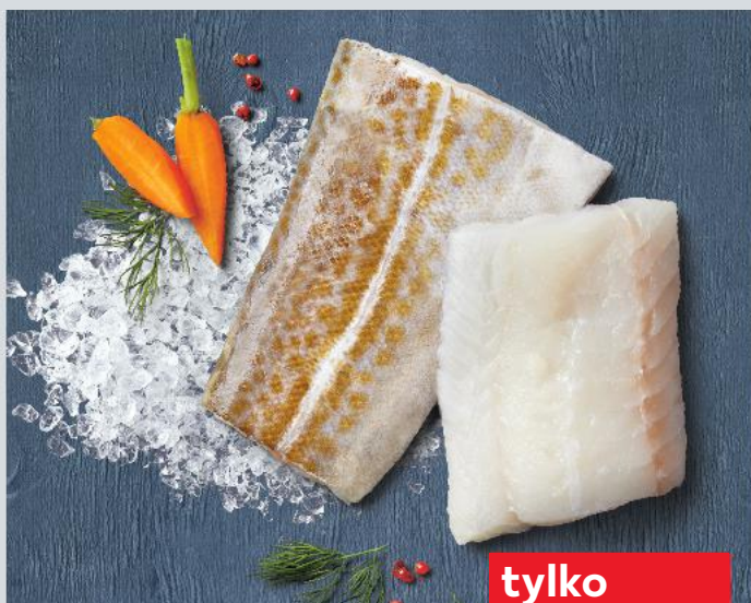
Dorsz atlantycki filet ze skórą 100 g