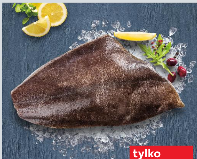
Halibut tusza 100 g