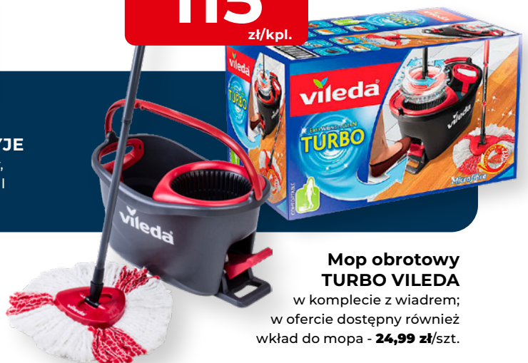
Mop obrotowy TURBO VILEDA w komplecie z wiaderem; w ofercie dostępny również wkład do mopa - 24,99 zł/szt.