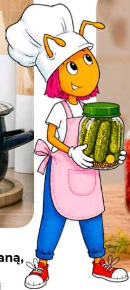
Garnek emaliowany o śr. 16 cm z pokrywą szklaną, granatowy, 1,3 l w ofercie dostępne również garnki o poj. 1,3-3,5 l, kubki emaliowane o śr. 9-10 cm w kolorach granatowym oraz taupe