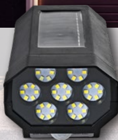
› Lampa solarna ścienna 42 LED atrapa kamery wym. 8 × 14,5 cm 1 kpl.