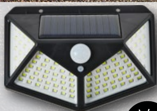
› Lampa solarna ścienna 100 SMD wym. 5 × 9,7 × 13,5 cm 1 szt.