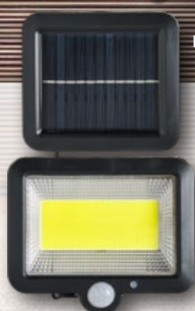
› Lampa solarna ścienna 100 LED COB wym. 5 × 9,7 × 13,5 cm 1 szt.