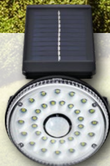
› Lampa solarna ścienna 32 SMD wym. 10 × 10 × 15 cm 1 szt.