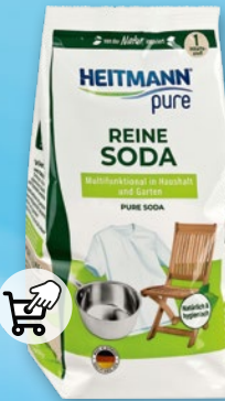
HEITMANN PURE CZYSTA SODA 500 G 34898619 686252