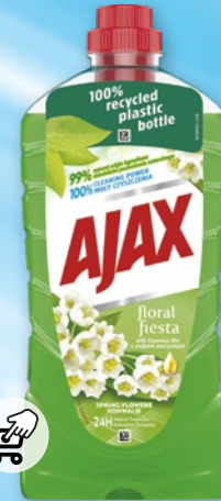
AJAX PŁYN UNIERSALNY 1 L • różne rodzaje 37554409 536108