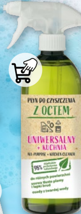
PŁYN DO KUCHNI, ŁAZIENKI 750 ML • dwa rodzaje 34603928 796815