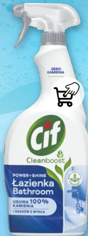
CIF SPRAY 750 ML • różne rodzaje 37661048 563771