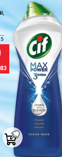
CIF MAX MLECZKO 1001 G • różne rodzaje 75160507 419969