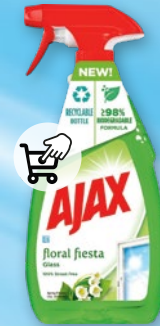
AJAX PŁYN DO SZYB 500 ML • różne rodzaje 11818820 522687