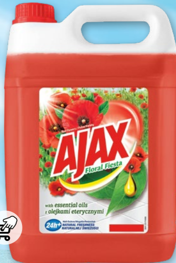
AJAX PŁYN UNIERSALNY 5 L • różne rodzaje 61390605 27183