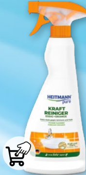
HEITMANN PURE ŚRODEK CZYSZCZĄCY 500 ML 28624880 780860