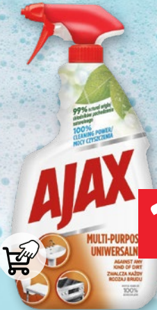
AJAX SPRAY 750 ML • różne rodzaje 61752863 44869