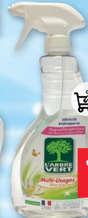
L'ARBRE VERT SPRAY DO CZYSZCZENIA 740 ML 23413537 547024