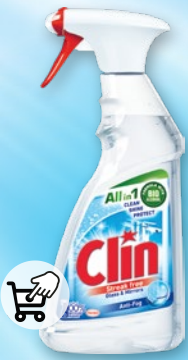
CLIN PŁYN DO SZYB 500 ML • różne rodzaje 86809753 459594