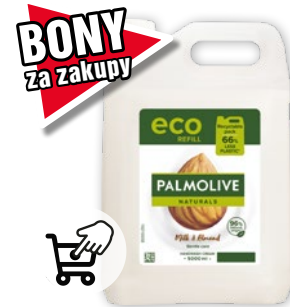
BONY za zakupy PALMOLIVE MYDŁO MIGDAŁOWE 5 L 687899 1 szt. z VAT 59.03 47 99