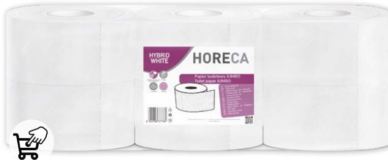
PAPIER TOALETOWY JUMBO 6 ROLEK 628623