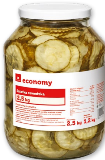
SALAATKA SZWEDZKA 2,5 KG