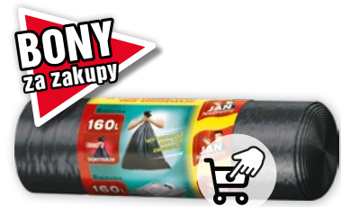
BONY za zakupy JAN NIEZBĘDNY WORKI NA ŚMIECI 160 L 20 SZT. 650822 1 opak. z VAT 23.36 18 99