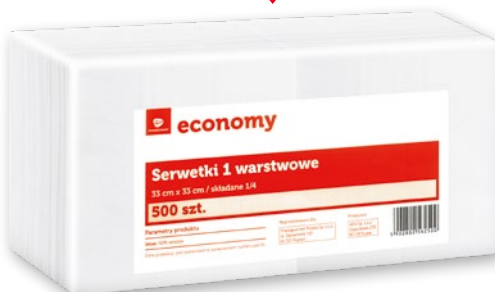
SERWETKI 1 WARSTWOWE 33 x 33 CM 500 SZT.