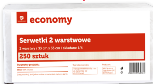
SERWETKI 2 WARSTWOWE 33 x 33 CM 250 SZT.