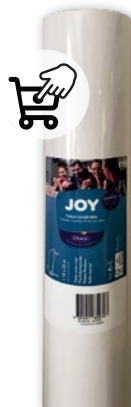
DUNI OBRUS BIAŁY 1,18 x 25 M 522285