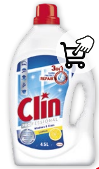
CLIN PŁYN DO SZYB 4,5 L 571897 1 szt. z VAT 49.19 39 99