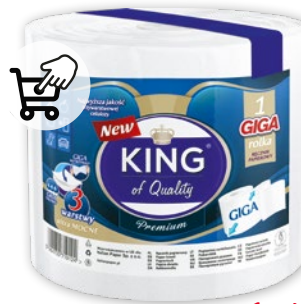
KING GIGA RĘCZNIK 1 ROLKA 365956