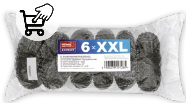
SPONTEX DRUCIAK 6 x 30 G 519096 1 opak. z VAT 12.29 9 99