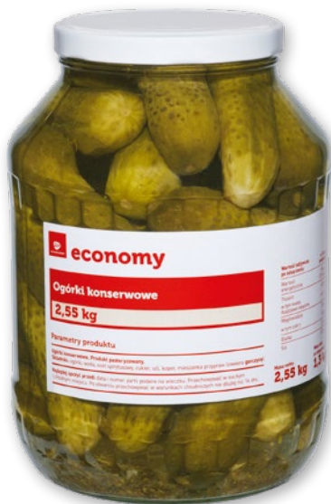
OGÓRKI KONSERWOWE 2,55 KG

Produkty marki Topseller XXL będą stopniowo zamieniane na tg Economy. Topseller i tg Economy na pewno spełnią oczekiwania tych z Państwa, dla których najniższa cena jest najważniejsza.