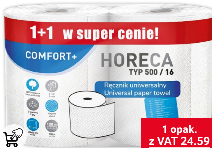
HORECA RĘCZNIK 2 ROLKI dwa rodzaje 111391