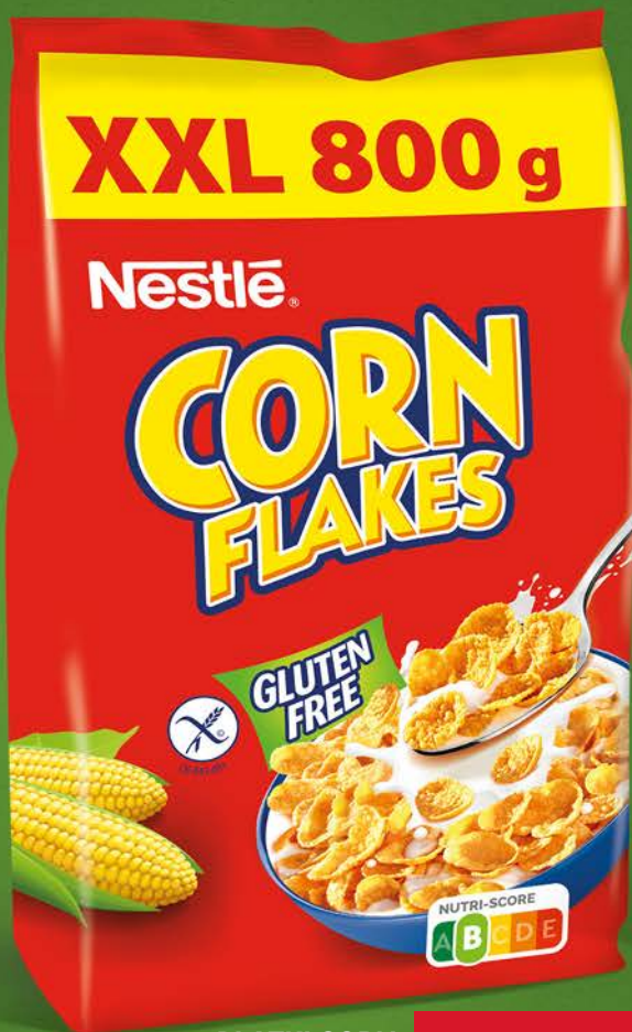
PLĄTKI CORN FLAKES NESTLÉ 800 g; 17,49 zł/kg Najniższa cena z ostatnich 30 dni – 16,99 zł