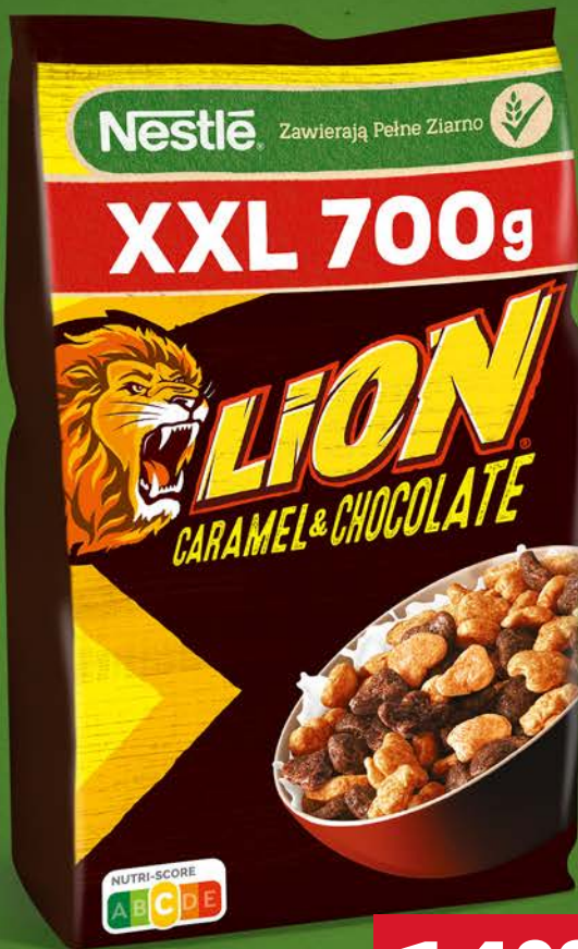
PLĄTKI LION NESTLÉ 700 g; 21,42 zł/kg Najniższa cena z ostatnich 30 dni – 17,99 zł