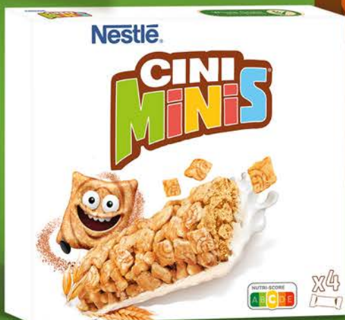
BATON NESTLÉ 4 x 25 g; wszystkie rodzaje Najniższa cena z ostatnich 30 dni – 6,99 zł