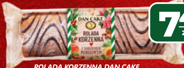
ROLADA KORZENNA DAN CAKE KORZENNA, 300 G, 1 KG/24,97 ZŁ