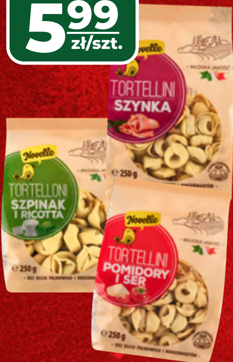
TORTELLINI MAKARONY POLSKIE WYBRANE RODZAJE, 250 G, 1 KG/23,96 ZŁ