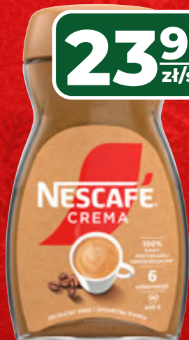
KAWA ROZPUSZCZALNA NESCAFE CREMA 200 G, 1 KG/119,95 ZŁ