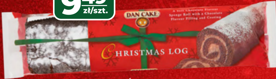
ROLADA ŚWIĄTECZNA DAN CAKE 370 G, 1 KG/25,65 ZŁ