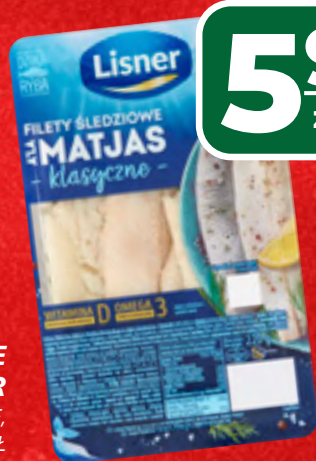
ŚLEDZIE W SOSIE LISNER WYBRANE RODZAJE, 280 G, 1 KG/28,54 ZŁ