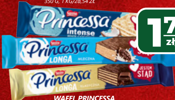
WAFEL PRINCESSA WYBRANE RODZAJE, 30,5-41G, 1 KG/43,66-58,69 ZŁ