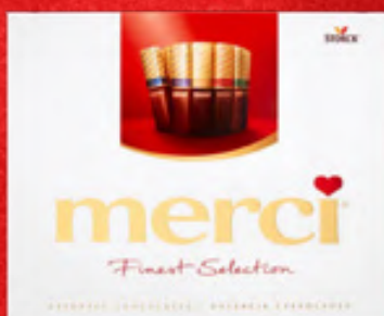
BOMBONIERKA MERCI WYBRANE RODZAJE, 210-250 G, 1 KG/71,96-85,67 ZŁ