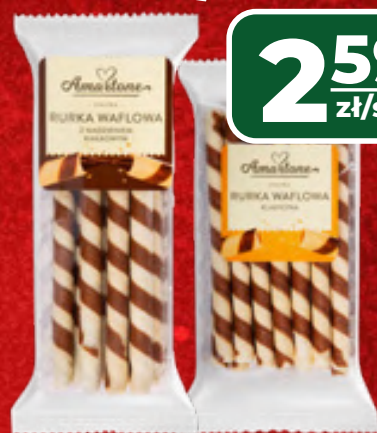
RURKA WAFLOWA KLASYCZNA, Z NADZIENIEM KAKAOWYM AMARTONE 100-140 G, 1 KG/18,50-25,90 ZŁ