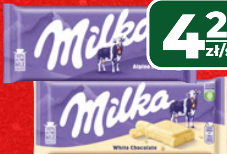
CZEKOLADA MILKA WYBRANE RODZAJE, 90-100G, 1 KG/42,90-47,67 ZŁ