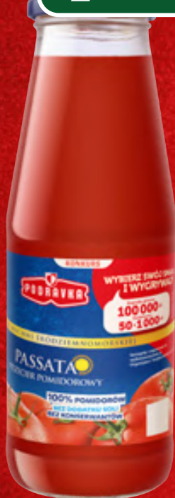
PRZECIER POMIDOROWY PASSATA PODRAVKA 680 G, 1 KG/11,16 ZŁ