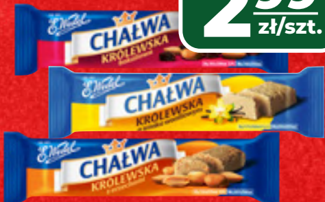
CHAŁWA KRÓLEWSKA E.WEDEL WYBRANE RODZAJE, 50 G, 1 KG/59,80 ZŁ