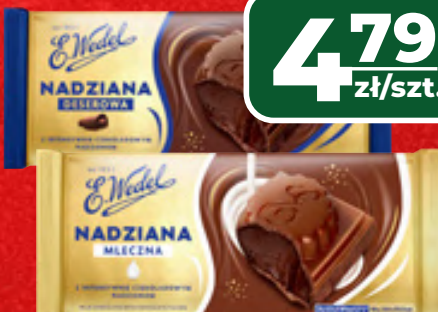
CZEKOLADA Z NADZIENIEM DESEROWYM E.WEDEL 100 G, 1 KG/47,90 ZŁ