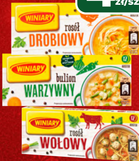
ROSÓŁ, BULION WINIARY WYBRANE RODZAJE, 120 G, 1 KG / 34,92 ZŁ