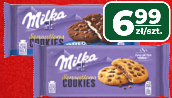
CIASTKA MILKA WYBRANE RODZAJE, 150-156 G, 1 KG/44,81-46,60 ZŁ