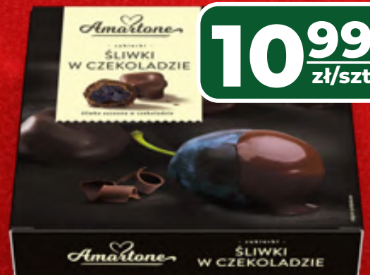
ŚLIWKI W CZEKOLADZIE AMARTONE 220 G, 1 KG/49,95 ZŁ