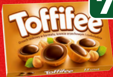
BOMBONIERKA TOFFIFEE 125G, 1 KG/63,92 ZŁ