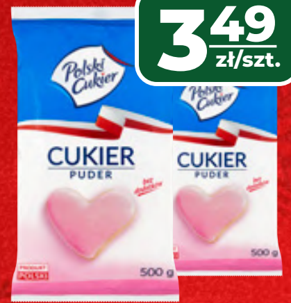
CUKIER PUDER 500 G, 1 KG/6,98 ZŁ