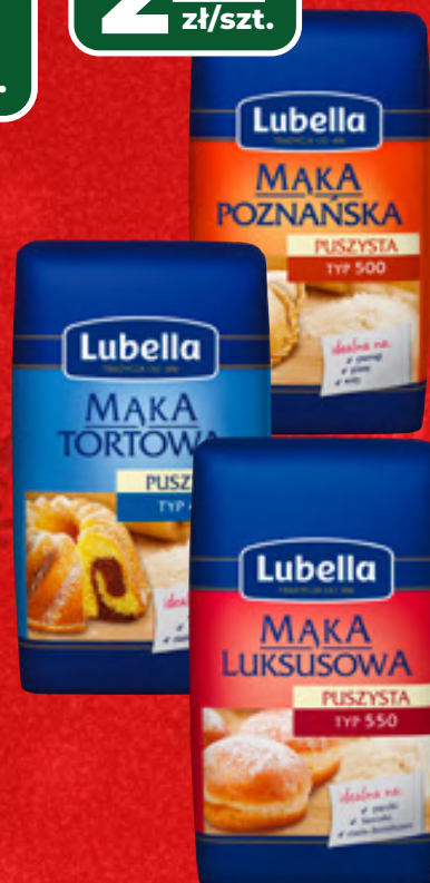
MAKA PUSZYSTA TYP 550 LUBELLA WYBRANE RODZAJE, 1 KG