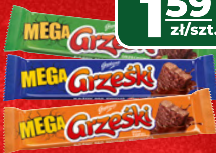
WAFLE GRZEŚKI WYBRANE RODZAJE, 48 G, 1 KG/33,13 ZŁ