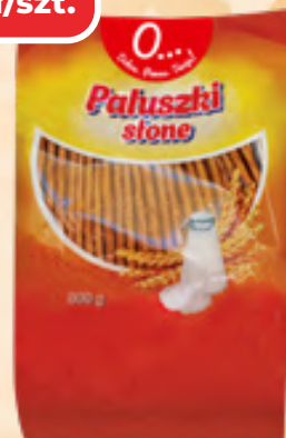
PALUSZKI SOLONE O... 300 G, 1 KG/9,63 ZŁ