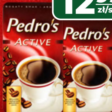
KAWA MIELONA PEDROS ACTIVE 250 G, 1 KG/51,96 ZŁ