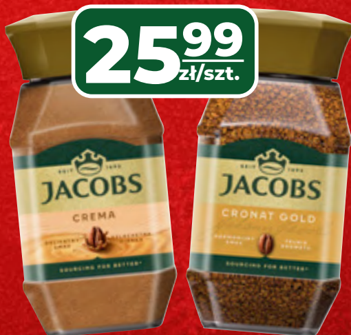
KAWA ROZPUSZCZALNA JACOBS CRONAT GOLD, CREMA 200G, 1 KG/129,95 ZŁ