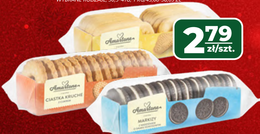
CIASTKA MARKIZY AMARTONE WYBRANE RODZAJE, 180 G, 1 KG/15,50 ZŁ