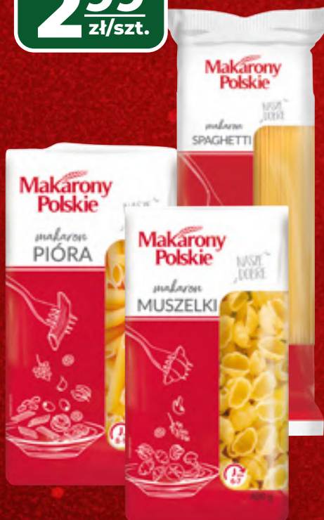
MAKARONY POLSKIE WYBRANE RODZAJE, 400 G, 1 KG/7,48 ZŁ