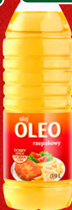
OLEJ RZEPAKOWY OLEO 900 ML, 1 L/6,10 ZŁ