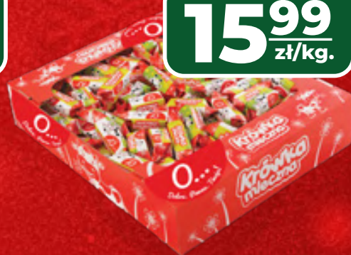
KRÓWKA MLECZNA O... 1 KG