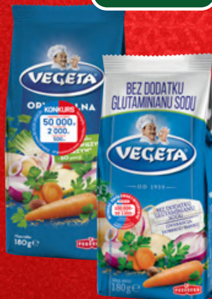
PRZYPRAWA VEGETA WYBRANE RODZAJE, 180 G, 1 KG/25,50 ZŁ