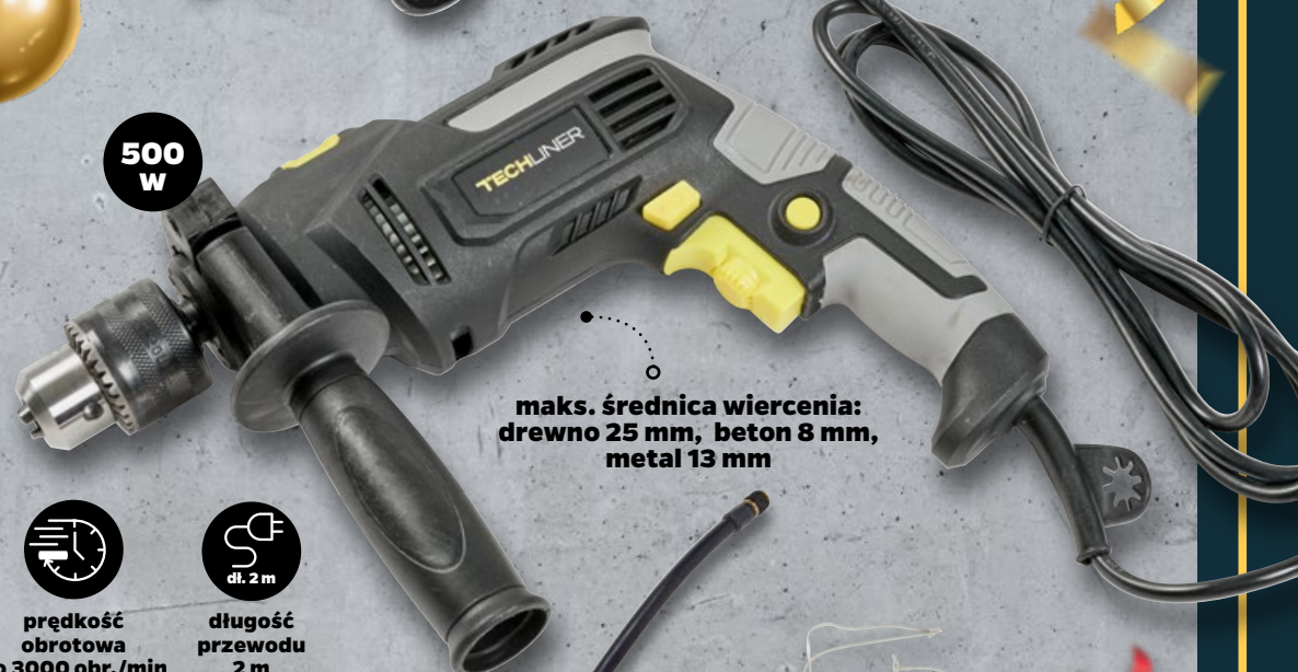
Wiertarka 1 szt.