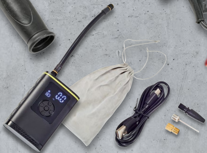
Kompresor Mini 1 kpl.