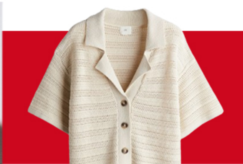
Koszula z ażurowej dzianiny 127,99 PLN