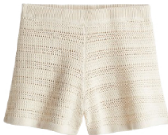
Szorty mini z ażurowej dzianiny 109,99 PLN