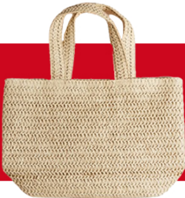
Słomkowa torba shopper 79,99 PLN