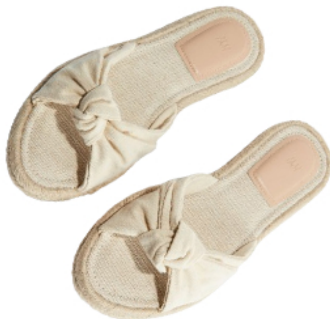
Kłapki typu espadryle z węzłem 54,99 PLN