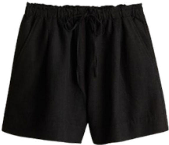
Szorty z domieszką Inu 79,99 PLN