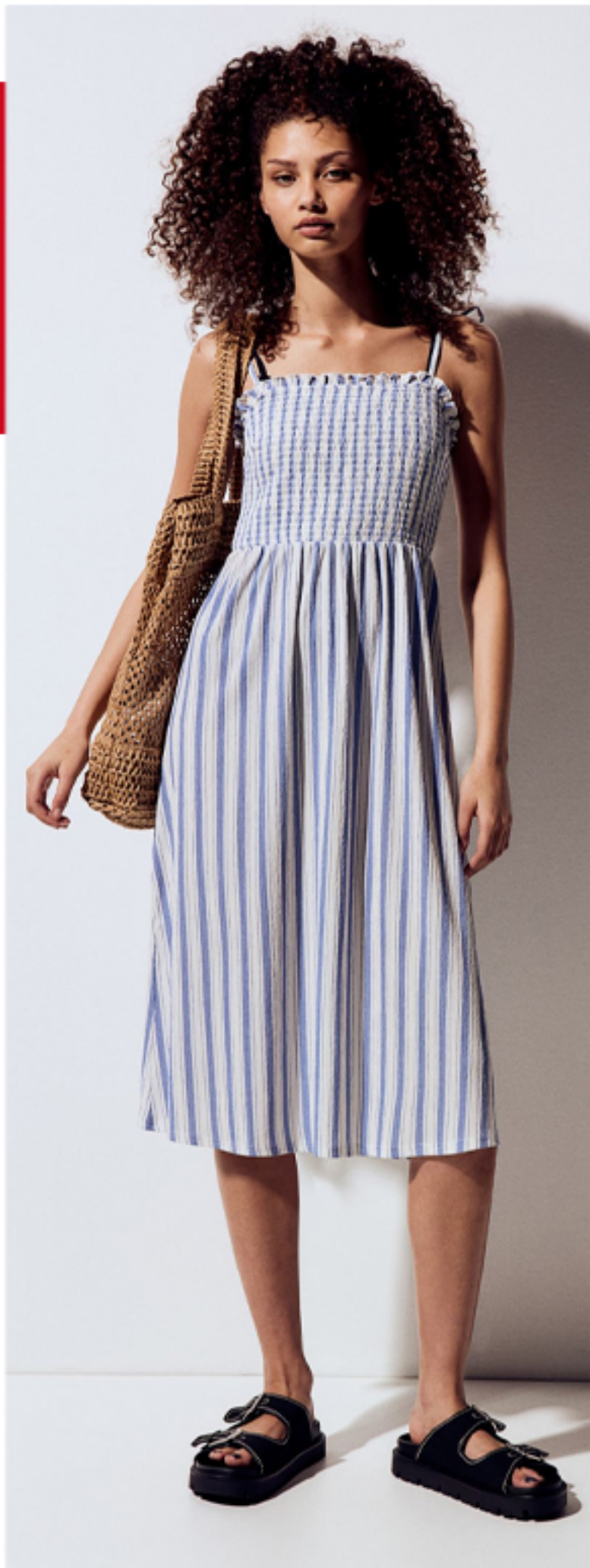
Sukienka na wiązanych ramiączkach 54,99 PLN