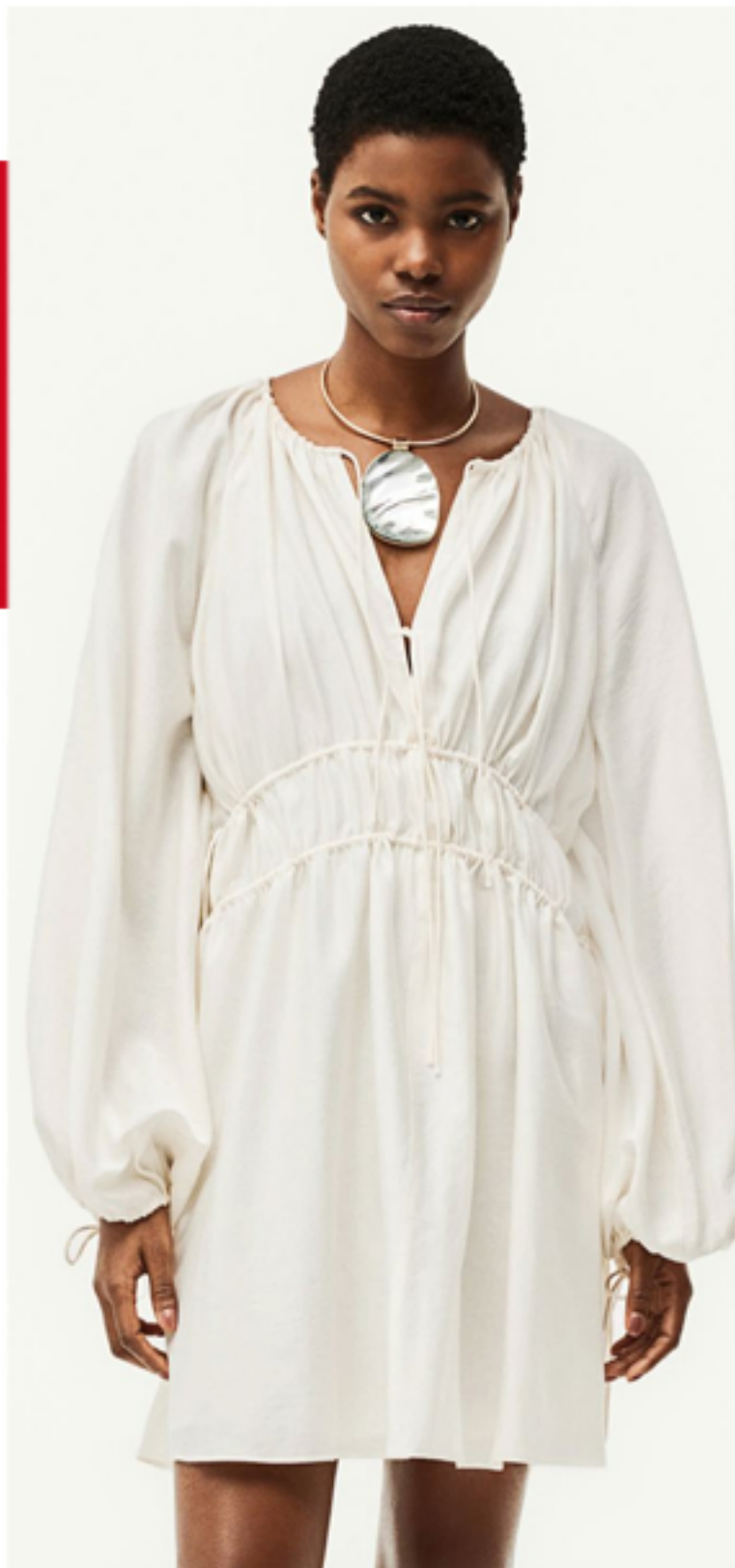
Sukienka oversize z wiązaniem 79,99 PLN