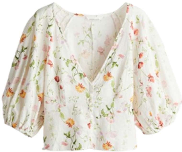
Bluzka z domieszką Inu 69,99 PLN