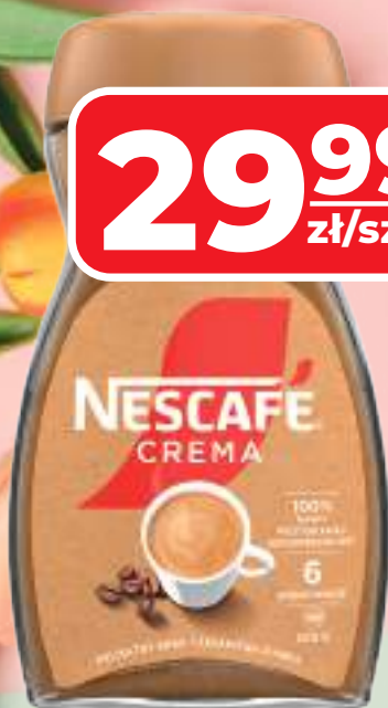
KAWA ROZPUSZCZALNA NESCAFE CREMA 200 G, 1 KG/149,95 ZŁ