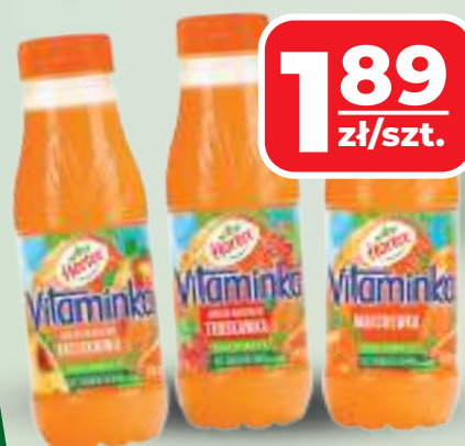
SOK VITAMINKA HORTEX WYBRANE RODZAJE, 300 ML, 1 L / 6,30 ZŁ

PRZY ZAKUPIE 4-PAKU cena za opak. 11,96 zł