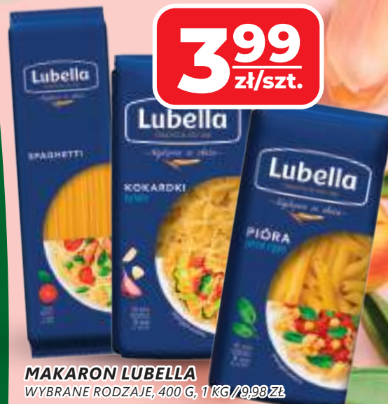
MAKARON LUBELLA WYBRANE RODZAJE, 400 G, 1 KG/9,98 ZŁ

1/2 LITRA PIWA ZAWIERA 25 GRAMÓW CZYSTEGO ALKOHOLU ETYLOWEGO