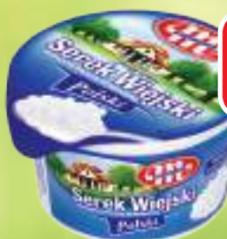
SEREK WIEJSKI POLSKI MLEKOVITA 200 G, 1 KG / 12,95 ZŁ