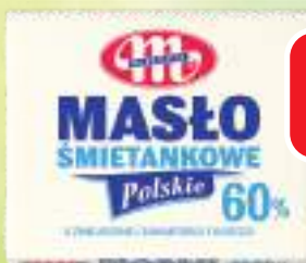
MASŁO ŚMIETANKOWE POLSKIE MLEKOVITA O OBNIŻONEJ ZAWARTOŚCI TŁUSZCZU, 200 G, 1 KG/34,95 ZŁ