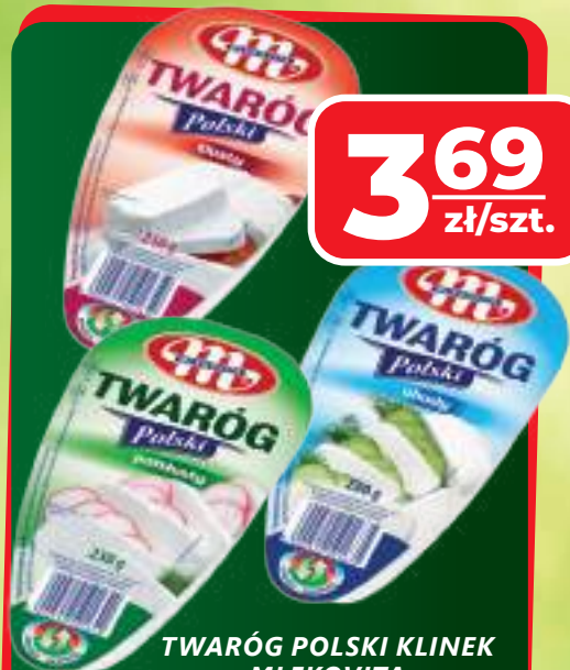
TWARÓG POLSKI KLINEK MLEKOVITA WYBRANE RODZAJE, 230 G, 1 KG / 16,04 ZŁ