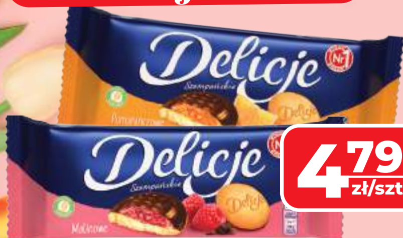
DELICJE SZAMPAŃSKIE E. WEDEL WYBRANE RODZAJE, 147 G, 1 KG/32,59 ZŁ