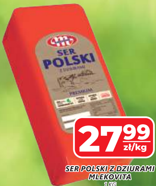
SER POLSKI Z DZIURAMI MLEKOVITA 1 KG