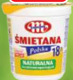
ŚMIETANA POLSKA 18% MLEKOVITA 400 G, 11 KG/11,23 ZŁ