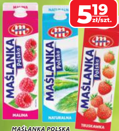
MAŚLANKA POLSKA MLEKOVITA WYBRANE RODZAJE, 1 L