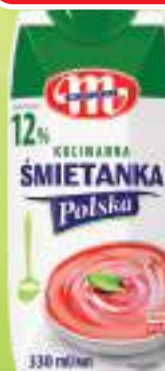
ŚMIETANKA POLSKA 12% UHT MLEKOVITA 330 ML, 1 L/14,52 ZŁ