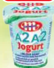
JOGURT NATURALNY A2A2 MLEKOVITA 140 G, 1 KG/29,93 ZŁ