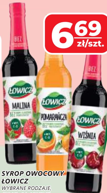
SYROP OWOCOWY ŁOWICZ WYBRANE RODZAJE, 400 ML, 1 L / 16,73 ZŁ