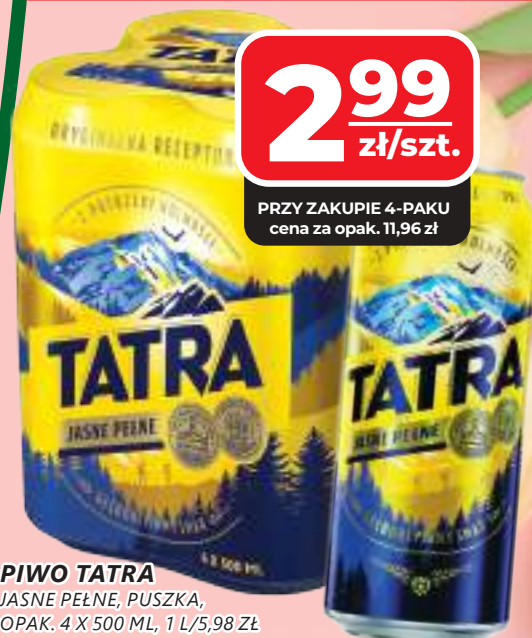
PIWO TATRA JASNE PEŁNE, PUSZKA, OPAK. 4 X 500 ML, 1 L/5,98 ZŁ