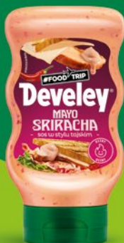
SOSY 300-460 G • wybrane rodzaje 881886