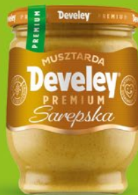
MUSZTARDA 270 G • wybrane rodzaje 902888