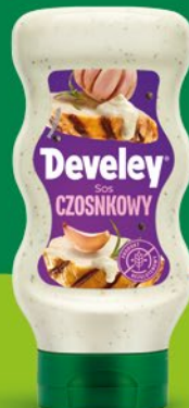
SOS CZOSNKOWY 840 G 693090