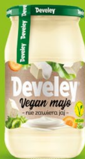
MAJONEZ WEGAŃSKI 390 ML 517970