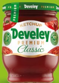
KETCHUP PREMIUM 300 G • klasyczny, pikantny 206970