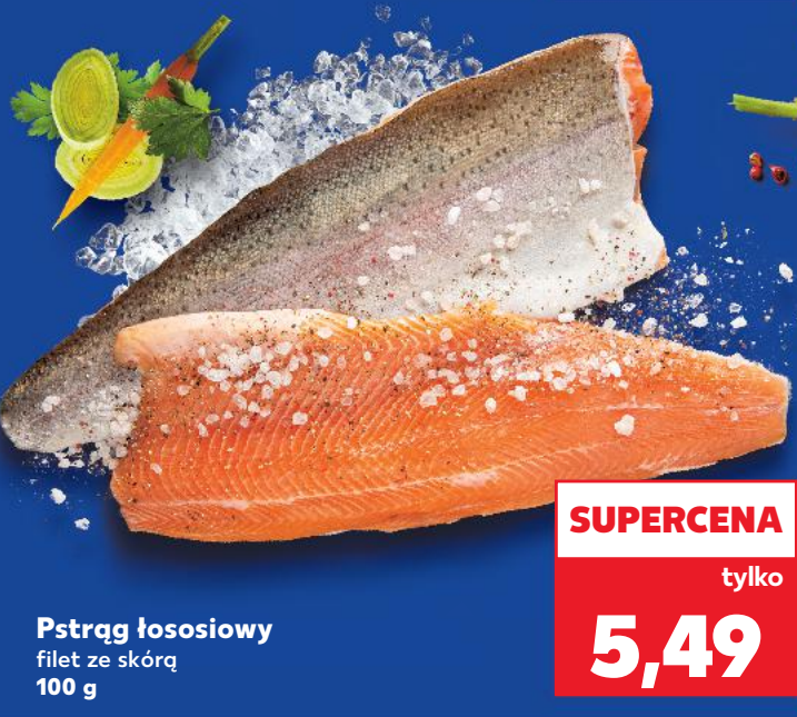
Pstrąg łososiowy filet ze skórą 100 g