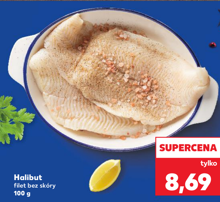
Halibut filet bez skóry 100 g

Cebulę ze szczypiorem oczyścić, umyć i pokroić w krążki. Czosnek obrać, zmiadźżyć i podsmażyć z cebulą na rozgrzanej oliwie. Dodać ryż i podsmażać przez 2 minuty, mieszając. Stopniowo dodawać bulion, włożyć szafran i gotować 30-40 minut na małym ogniu, od czasu do czasu mieszając. Rybę umyć, osuszyć, doprawić solą i pieprzem i obtoczyć w zmielonych orzechach. Rozgrzać masło, smażyć rybę 8-12 minut na chrupiąco. Do risotta dodać parmezan i doprawić solą i pieprzem. Rybę podawać z risottem. Do dania pasuje rozszponka z dressingiem cebulowym.