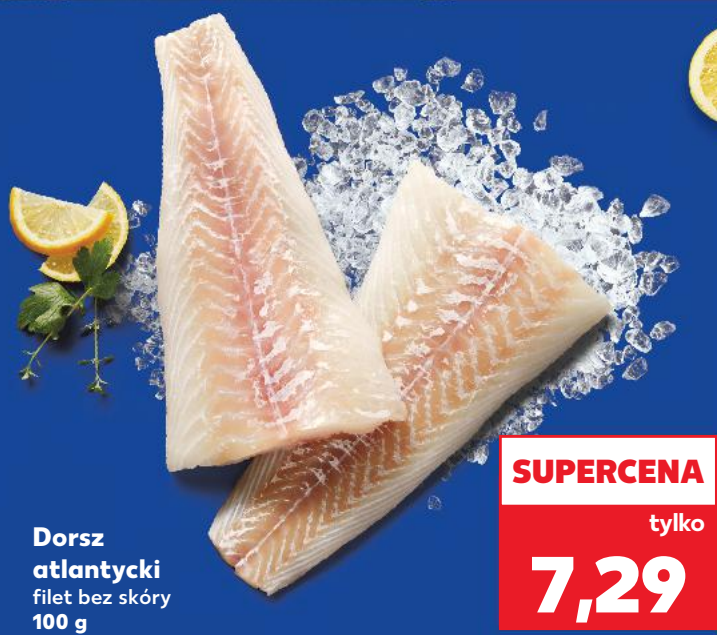
Dorsz atlantycki filet bez skóry 100 g