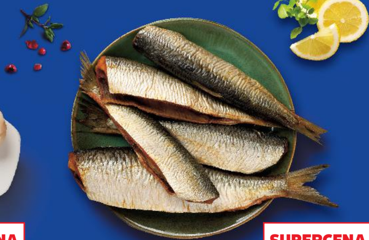
Tuszka śledziowa wędzona 100 g