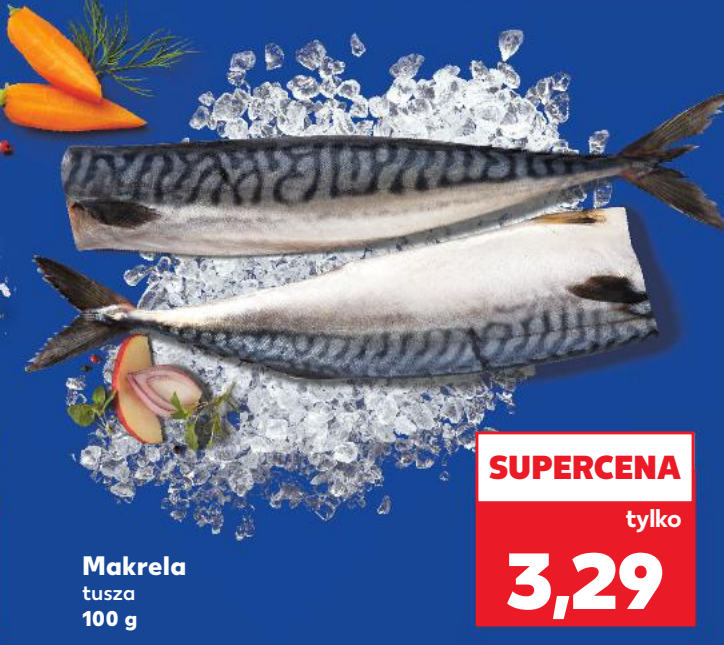
Makrela tusza 100 g