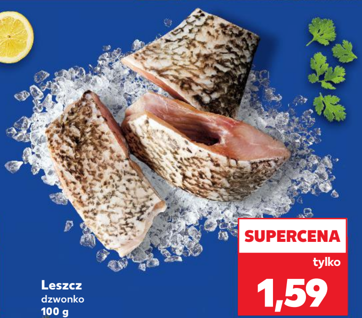
Leszcz dzwonek 100 g