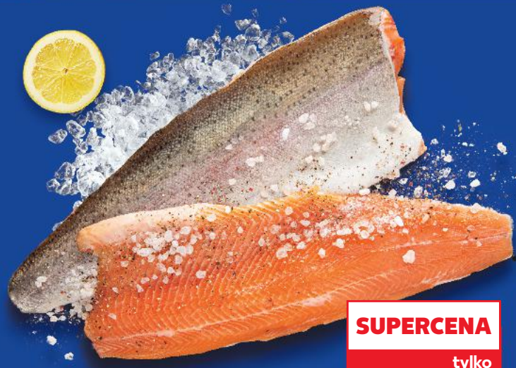
Pstrąg łososiowy filet ze skórą 100 g