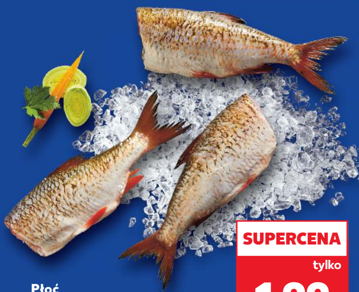
Płoc tuszka 100 g