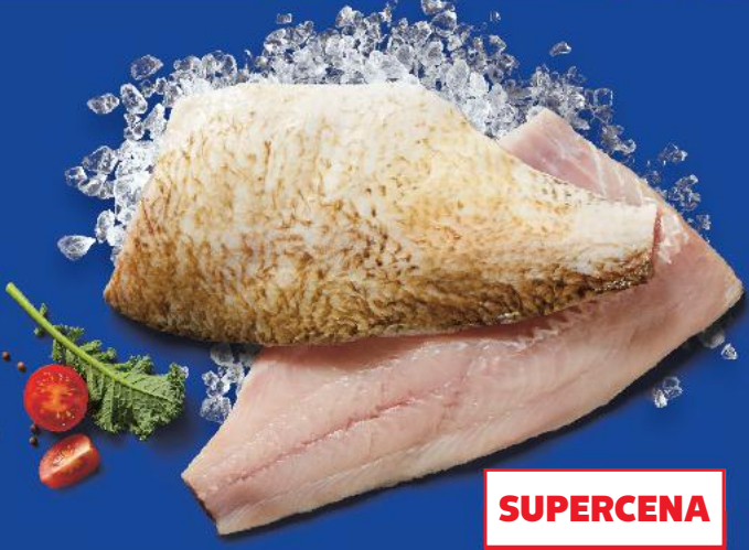
Leszcz płać ze skórą 100 g