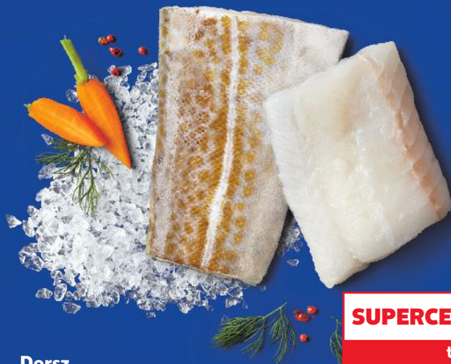
Dorsz atlantycki filet ze skórą 100 g

Filety umyć, osuszyć, pokroić w dużą kostkę, skropić sokiem z cytryny i posolić. Cebule obrać. Pokroić w kostkę cebule, ogórki i boczek. Papryki umyć, oczyścić i pokroić w duże kawałki. W rondlu rozgrzać olej, podsmażyć boczec. Dodać cebulę i paprykę, chwilę smażyć, mieszając. Dodać koncentrat pomidorowy i paprykę w proszku, chwilę jeszcze smażyć. Wlać bulion, doprowadzić do wrzenia i gotować ok. 15 min. Po 10 min dodać rybę i ogórki, chwilę trzymać na małym ogniu. Do gulaszu dodać śmietanę i koperek, doprawić do smaku solą i pieprzem. Podawać na talerzach do zupy, z ulubionym pieczywem.