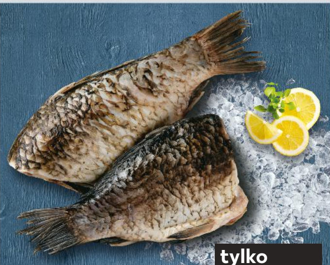
Karaś tusza 100 g