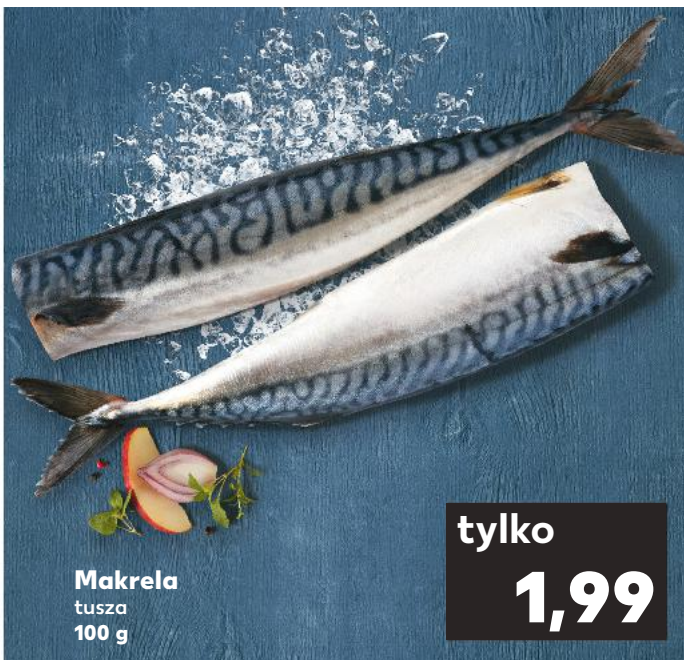
Makrela tusza 100 g