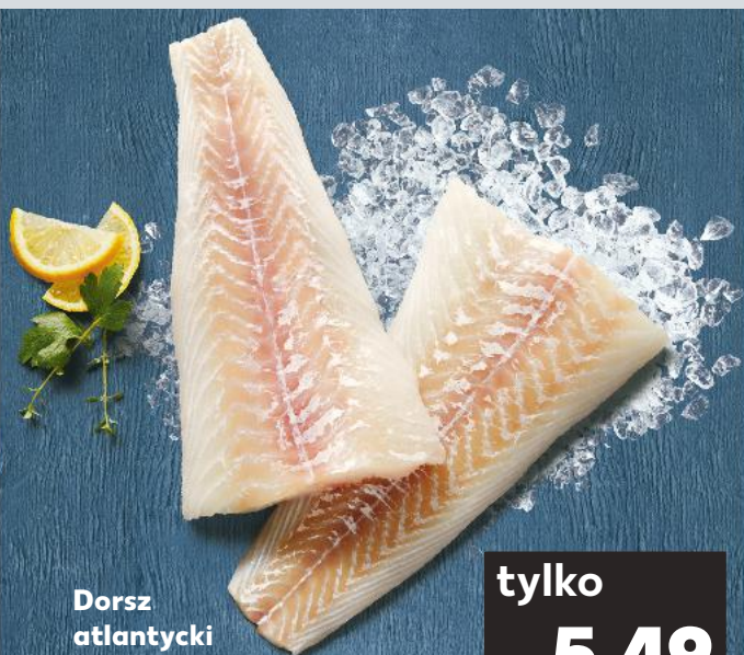
Dorsz atlantycki filet bez skóry 100 g