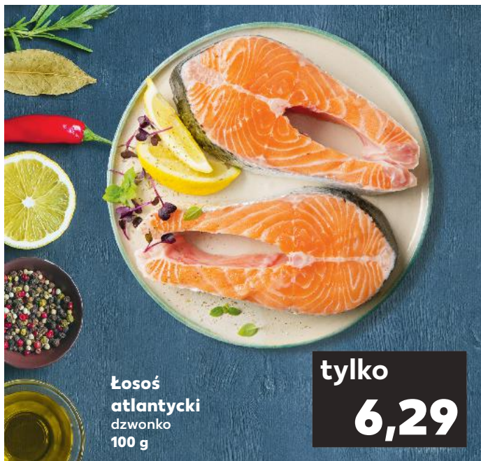
Łosoś atlantycki dzwonko 100 g

Ogórkę zielonego obrać i pokroić w cienkie plasterki. Ogórki konserwowe również pokroić w cienkie plasterki. Szczypiorek opłukać, osuszyć i posiekać. Białą część dymki oczyścić, umyć i bardzo drobno pokroić. Przygotowane składniki ułożyć na talerzach. Wymieszać ocet z solą, pieprzem, cukrem i 3 łyżkami oleju. Trochę zostawić, resztą skropić ogórki. Dzwonka łososia opłukać i osuszyć. Pozostały olej rozgrzać, smażyć łososia przez 3-4 minuty z każdej strony. Doprawić solą i pieprzem. Usmażone dzwonka łososia ułożyć na ogórkach, połączyć pozostałą marynatą i podawać przybrane np. rzęszuchą i kolendrą.