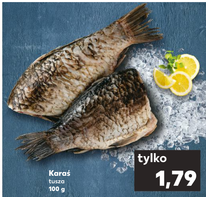
Karaś tusza 100 g