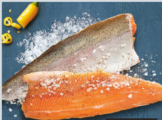
Pstrąg łososiowy filet ze skórą 100 g