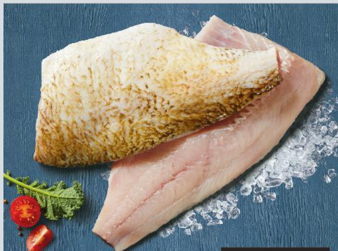
Leszcz płat ze skórą 100 g