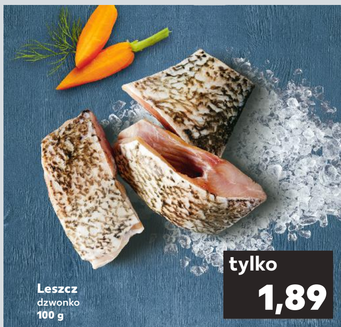
Leszcz dzwonko 100 g