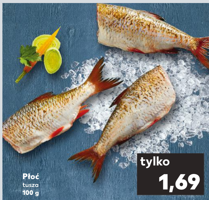
Płoc tusza 100 g