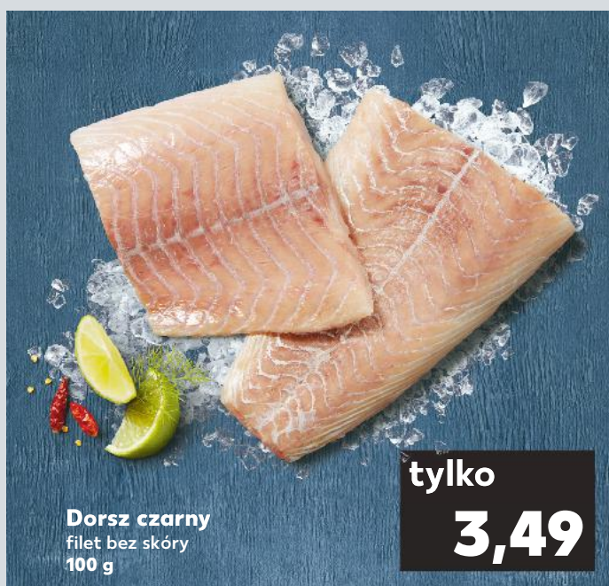
Dorsz czarny filet bez skóry 100 g