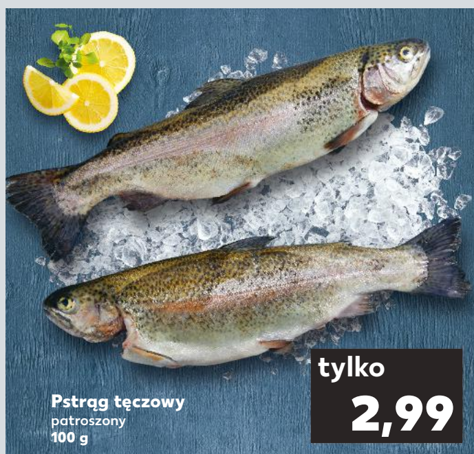
Pstrąg tęczowy patroszony 100 g