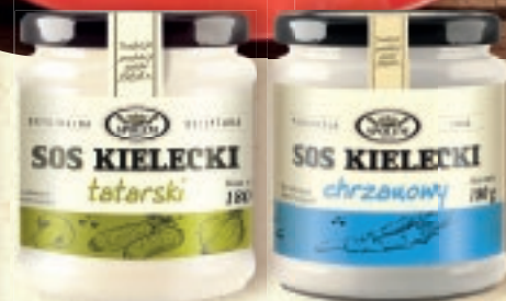
SOS KIELECKI 180–200 g: tatarski, cygański, czosnkowy, amerykański, chrzanowy

Śledź pod pierzynką z Majonezem kieleckim. Najlepszey!