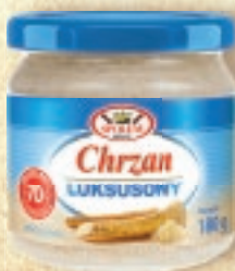
CHRZAN LUKSUSOWY 180 g