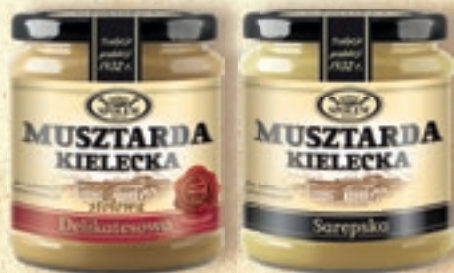
MUSZTARDA KIELECKA 190 g: delikatesowa, kremśka, sarepska