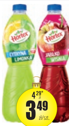
NAPÓJ GAZOWANY Z ZAWARTOŚCIĄ 20% SOKU 1,75 L RÓŻNE SMAKI I RODZAJE, ORANŻADA: CZERWONA, ŻÓŁTA, NAPÓJ NIEGAZOWANY 1,75 L RÓŻNE SMAKI, POLO COCKTA GAZOWANA Z ZAWARTOŚCIĄ 20% SOKU 2 L [ZBYSZKO] 2,00-2,28 zł/l