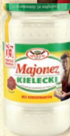
MAJONEZ KIELECKI 310 ml

Doskonały smak, kremowa konsystencja i najwyższej jakości składniki sprawiają, że Kielecki od pokoleń gości na świątecznym stole. Dlatego Ty też podkreśl już dziś smak świątecznych dań.