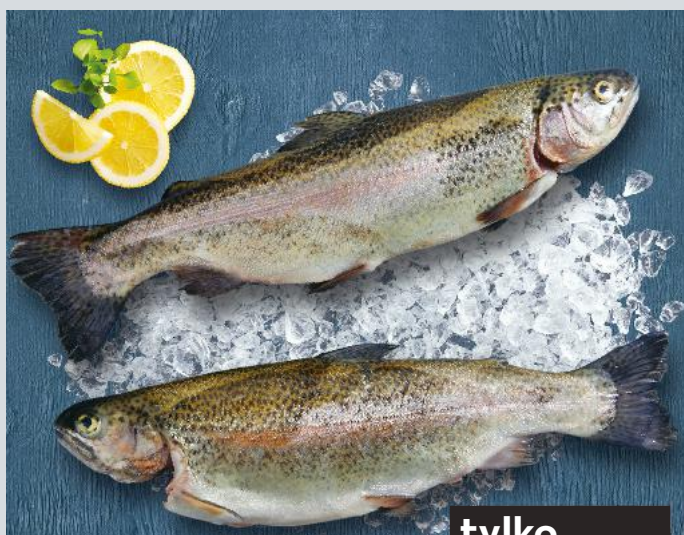
Pstrąg tęczowy patroszony 100 g