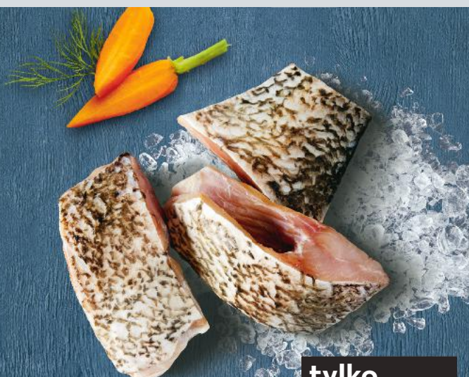
Łeśzcz dzwonko 100 g