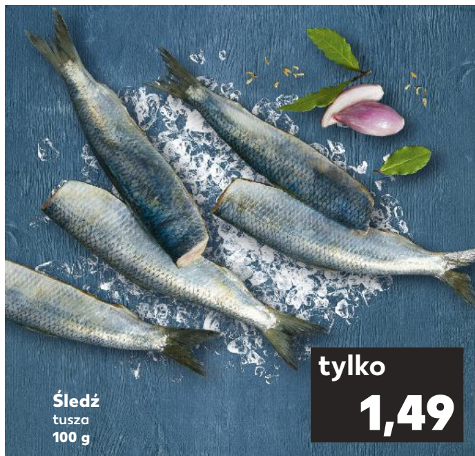
Śledź tusza 100 g