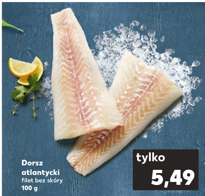
Dorsz atlantycki filet bez skóry 100 g

Filety umyć, osuszyć, pokroić w dużą kostkę, skropić sokiem z cytryny i posolić. Cebule obrać. Pokroić w kostkę cebule, ogórki i boczek. Papryki umyć, oczyścić i pokroić w duże kawałki. W rondlu rozgrzać olej, podsmażyć boczki. Dodać cebulę i paprykę, chwilę smażyć, mieszając. Dodać koncentrat pomidorowy i paprykę w proszku, chwilę jeszcze smażyć. Wlać bulion, doprowadzić do wrzenia i gotować ok. 15 min. Po 10 min dodać rybę i ogórki, chwilę trzymać na małym ogniu. Do gulaszu dodać śmietanę i koperek, doprawić do smaku solą i pieprzem. Podawać na talerzach do zupy, z ulubionym pieczywem.