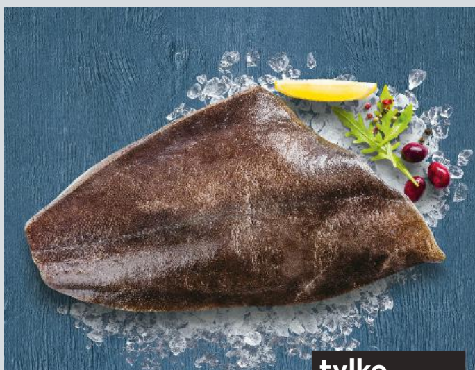
Halibut tusza 100 g