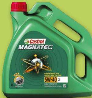
OLEJ SILNIKOWY MAGNATEC 5W-40 4 L 59217364 29173