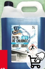
PLYN DO CHŁODNIC 5 L FENIKS 12543567 265050