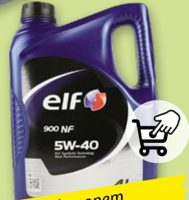
OLEJ SILNIKOWY ELF EVOLUTION 900 NF 5W-40 4 L

• cena regularna za 1 szt.: 119.00, z VAT 146.37 • najniższa cena towaru w okresie 30 dni przed wprowadzeniem obniżki za 1 szt.: 89.90, z VAT 110.58