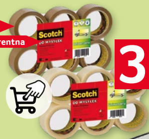
Scotch TAŚMY PAKOWE 6 SZT. 76614023 8163

długość: 66 m szerokość: 50 mm brązowa i transparentna