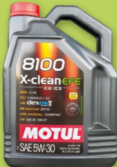
OLEJ SILNIKOWY MOTUL 8100 X-CLEAN 5W-30 5 L 14420194 732961