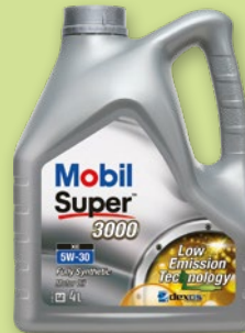
Mobil Super OLEJ SILNIKOWY SUPER 3000 XE 5W-30 4 L 25416892 485356