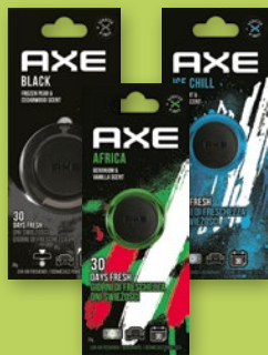
ZAPACHY SAMOCHODOWE AXE • różne rodzaje 40116444 352294