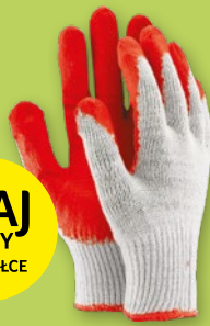
RĘKAWICE POWLEKANE 10 PAR 77910321 610404