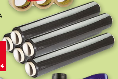
FOLIA STRETCH 1,45 KG CZARNA • grubość: 23 mikr. • waga: 1,45 kg 40711046 140705